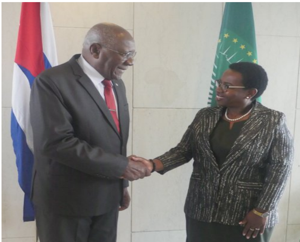
Valdés Mesa y Monique Nsanzabaganwa.

A Fidel especial gratitud: En Etiopía amamos a Fidel, que tiene un lugar muy grande en nuestros corazones, agregó el dirigente etíope.