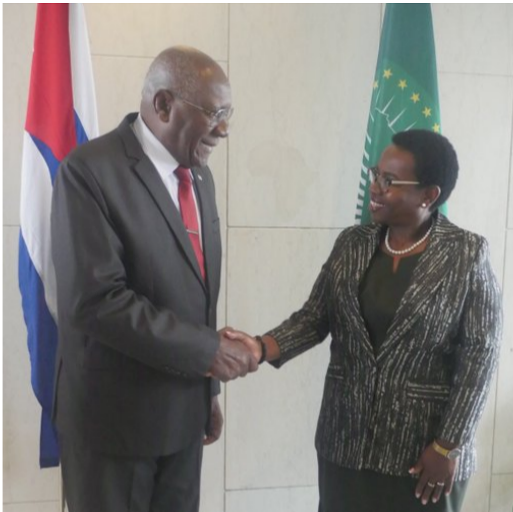
Valdés Mesa et Monique Nsanzabaganwa.

Une gratitude particulière pour Fidel : en Éthiopie, nous aimons Fidel, qui occupe une place très importante dans nos cœurs, a ajouté le dirigeant éthiopien.