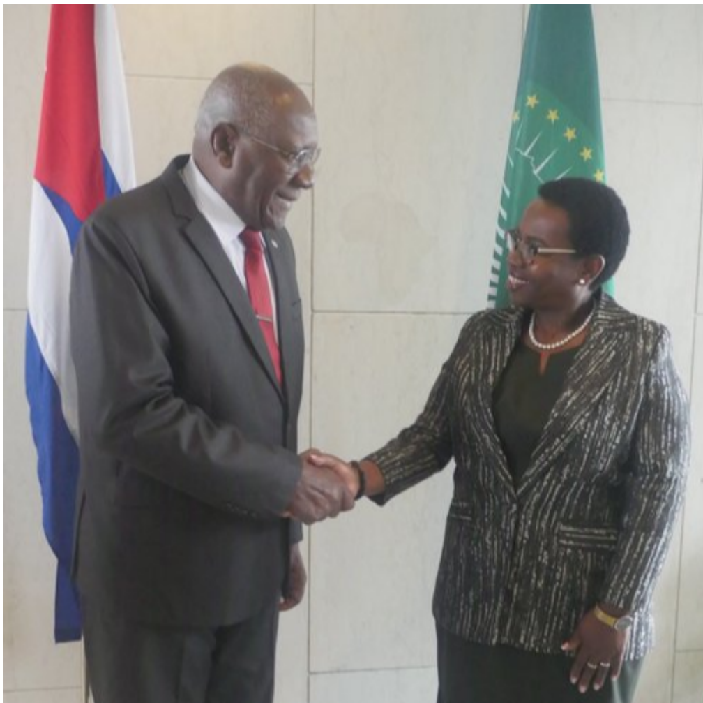
Valdés Mesa et Monique Nsanzabaganwa.

Une gratitude particulière pour Fidel : en Éthiopie, nous aimons Fidel, qui occupe une place très importante dans nos cœurs, a ajouté le dirigeant éthiopien.