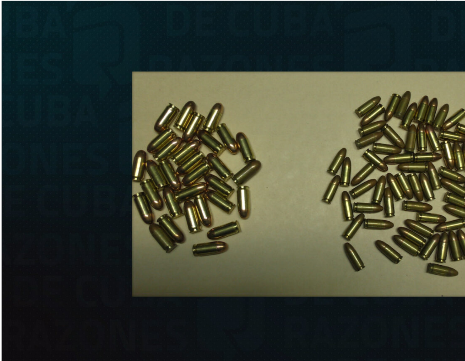
Armes saisies lors de l'arrestation