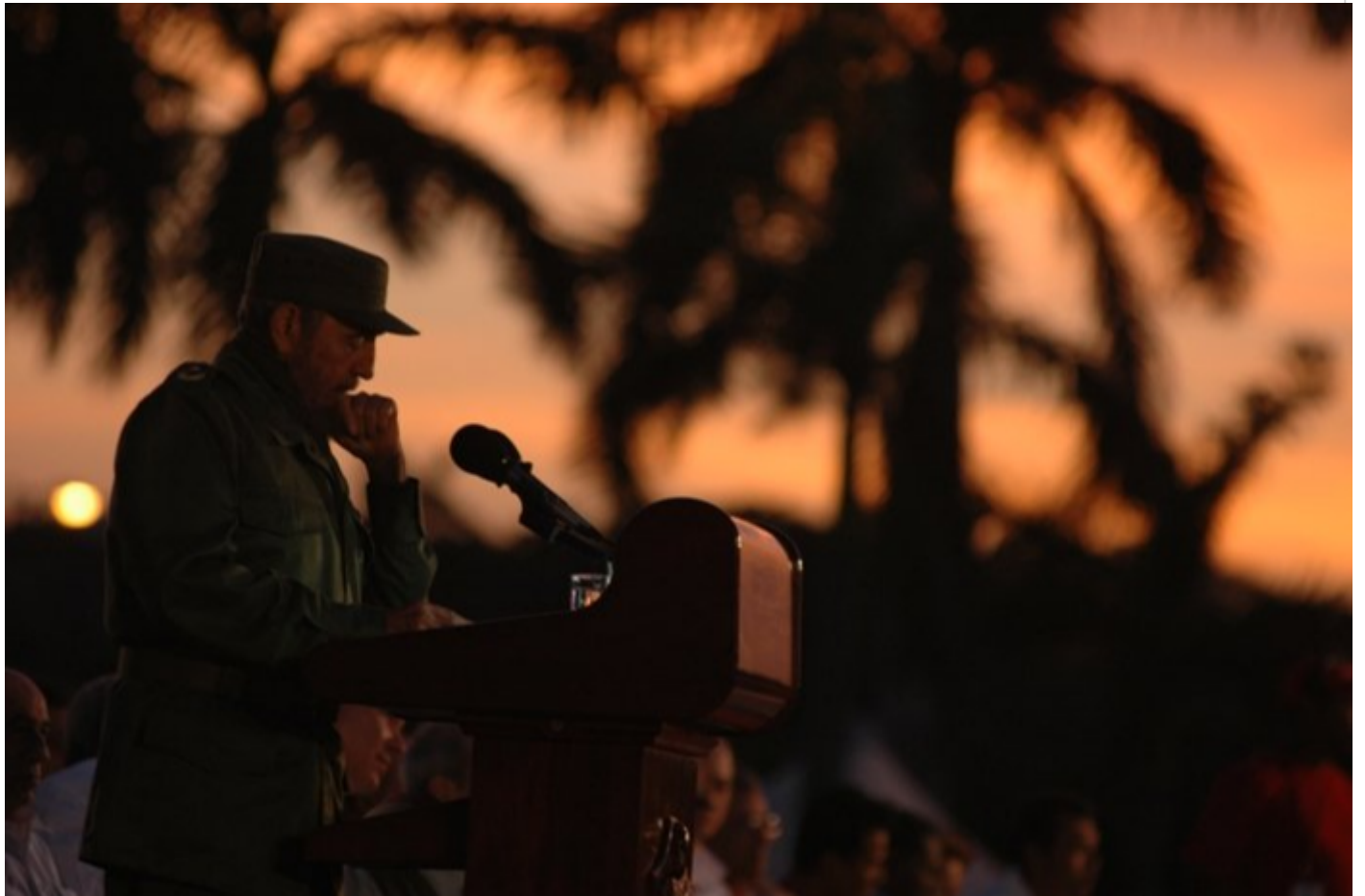
Fidel Alba Bolivie Rassemblement populaire sur la Plaza de la Revolución pour célébrer l'entrée de la Bolivie dans l'ALBA, 29 avril 2006.

Il y a près de vingt ans, Fidel et Chávez ont franchi un pas historique en fondant une alternative bolivarienne et humaniste qui s'est transformée en une alliance de paix, de coopération et de solidarité, pour le bien commun et l'union de notre Amérique. Deux géants ont tracé un chemin de lutte et de résistance. Il appartient aux dirigeants d'aujourd'hui, avec leurs peuples, de continuer à faire flotter le drapeau de l'optimisme et de l'espoir, de la solidarité et de la pleine intégration.