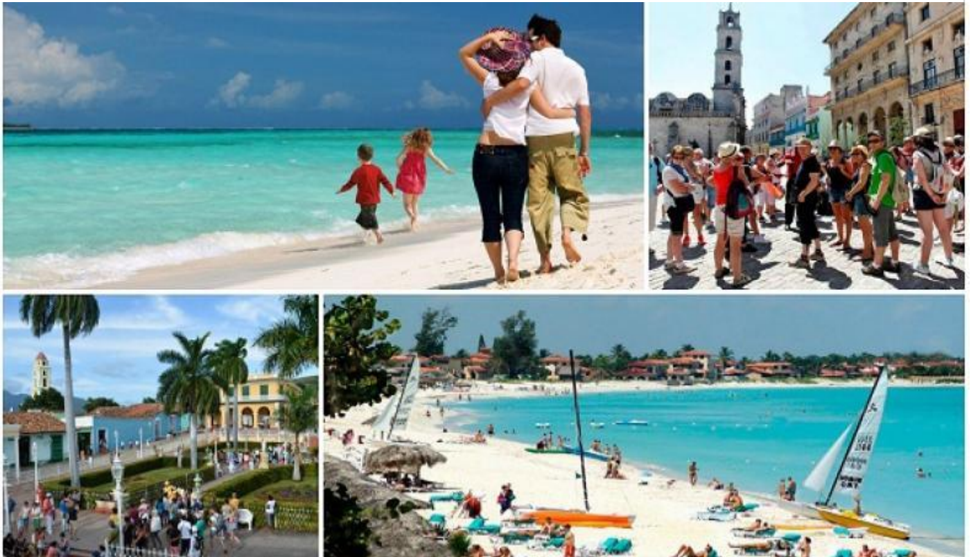
Turismo en Cuba