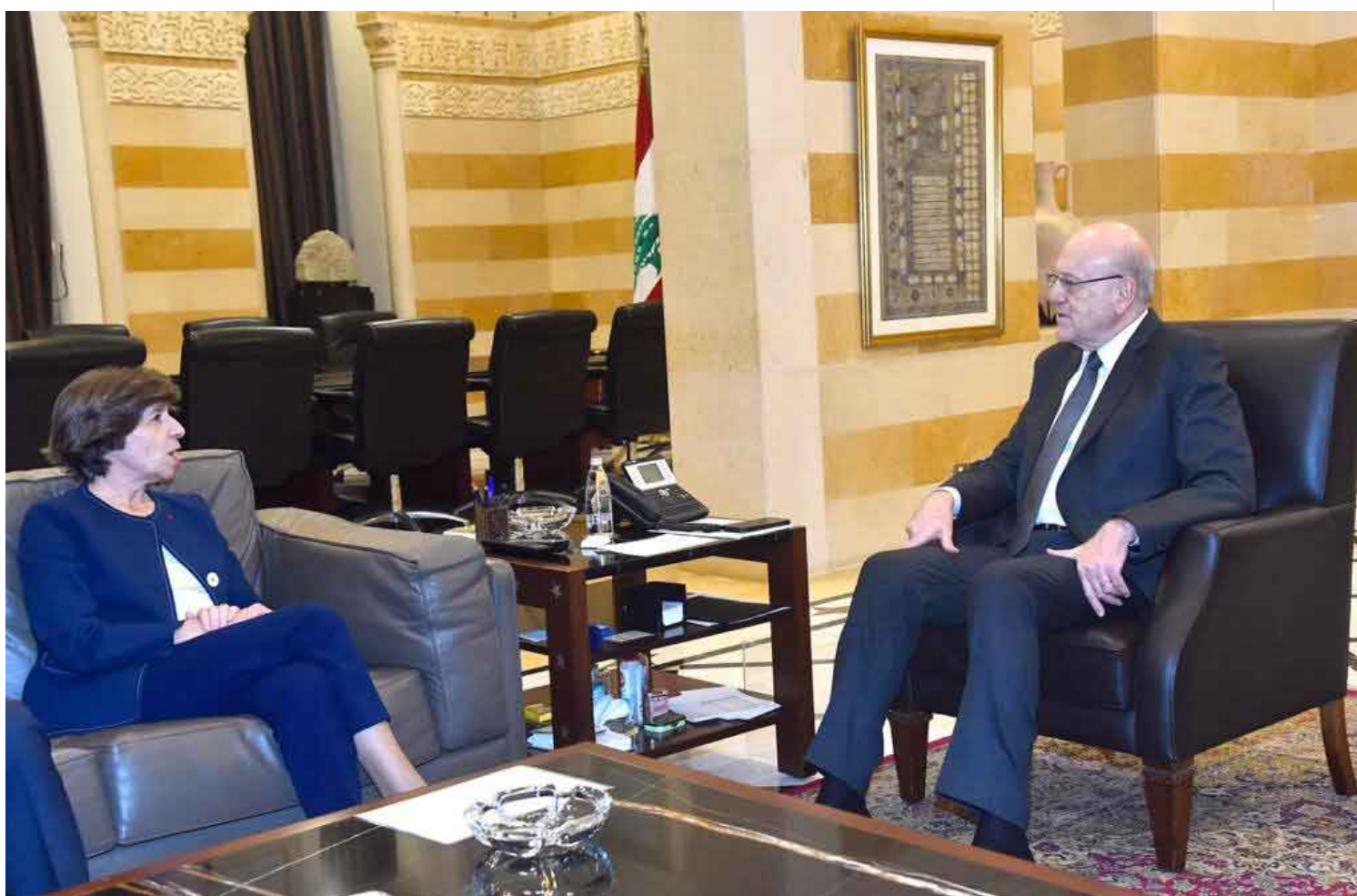
Najib Mikati y Catherine Colonna.

Beirut, 18 dic (RHC) El primer ministro interino de Líbano, Najib Mikati, y la titular de Relaciones Exteriores de Francia, Catherine Colonna, discutieron este lunes la situación en el sur del país levantino tras la agresión israelí.