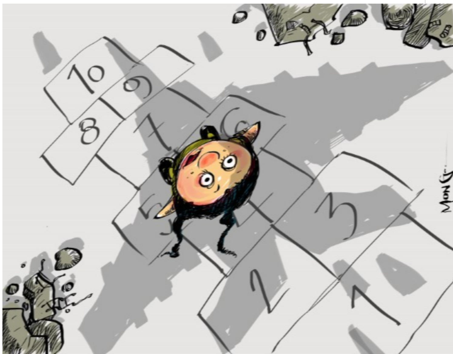
"Sombras", obra de Ramón Díaz en el XXII Salón Internacional de Humor Gráfico.