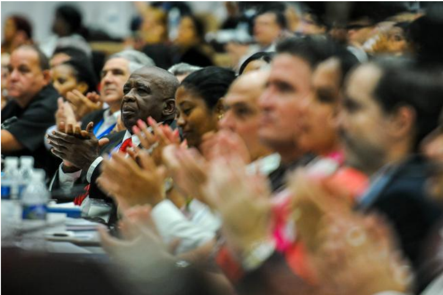
Diputados cubanos en sesión ordinaria de la Asamblea Nacional del Poder Popular

La víspera, en el cierre del Segundo Período de Sesiones de la X Legislatura del parlamento, los diputados sancionaron las normativas sobre Salud pública, la Fiscalía Militar, y la Atención a las quejas y denuncias de la población, por ese orden.