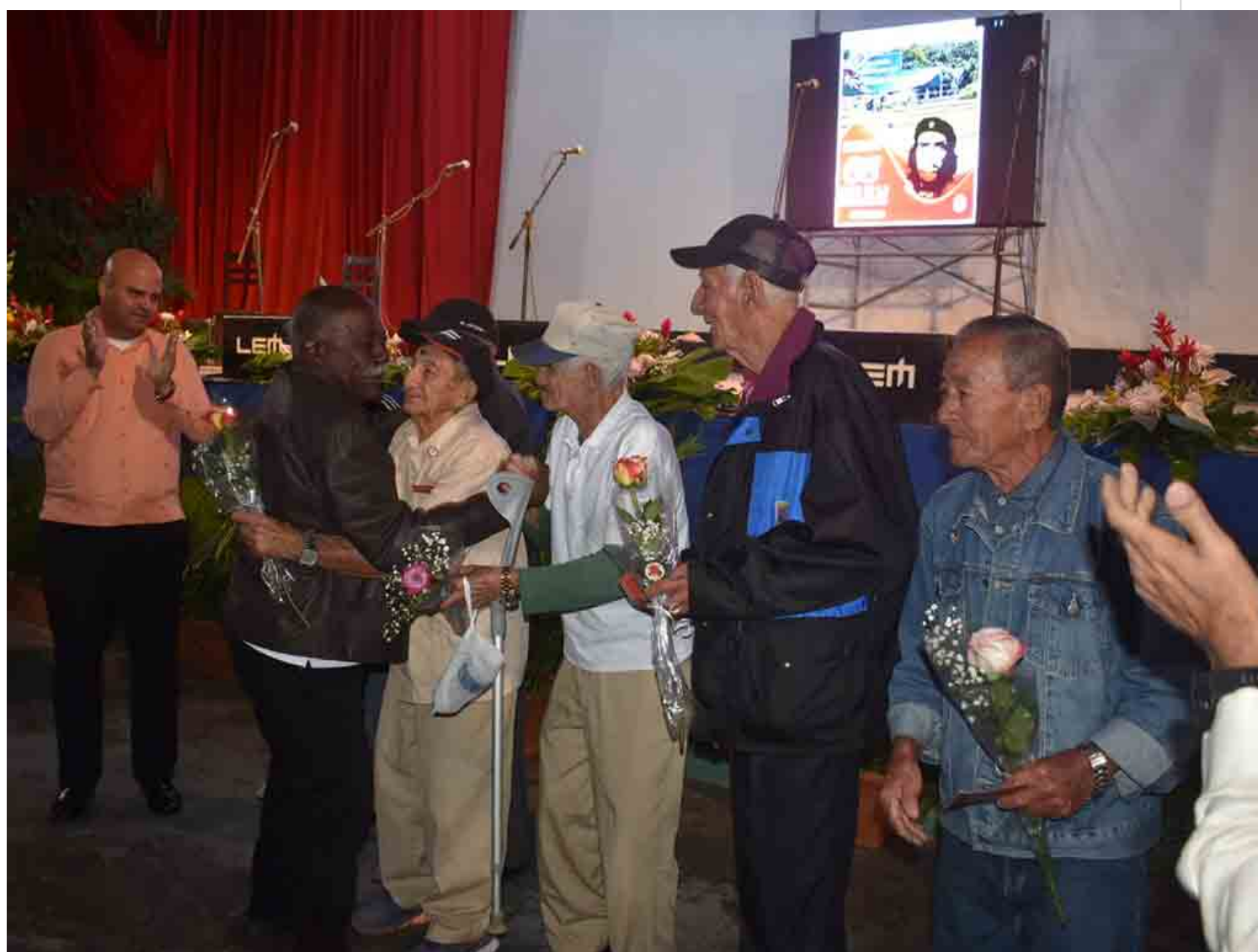
Homenaje a combatientes participantes en la Batalla de Santa Clara.