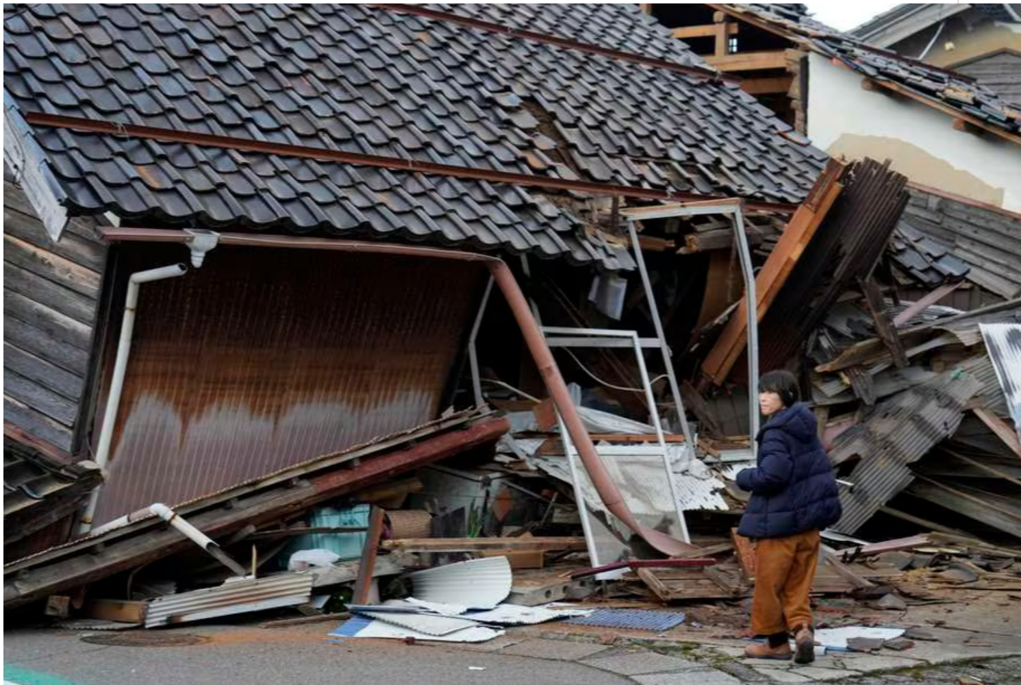
Intenso terremoto afectó a la costera ciudad de Ishikawa.

La Habana, 2 ene (RHC) El presidente de Cuba, Miguel Díaz-Canel, expresó este martes su solidaridad con las autoridades y el pueblo de Japón ante los desastres ocurridos en esa nación asiática al iniciar el 2024.