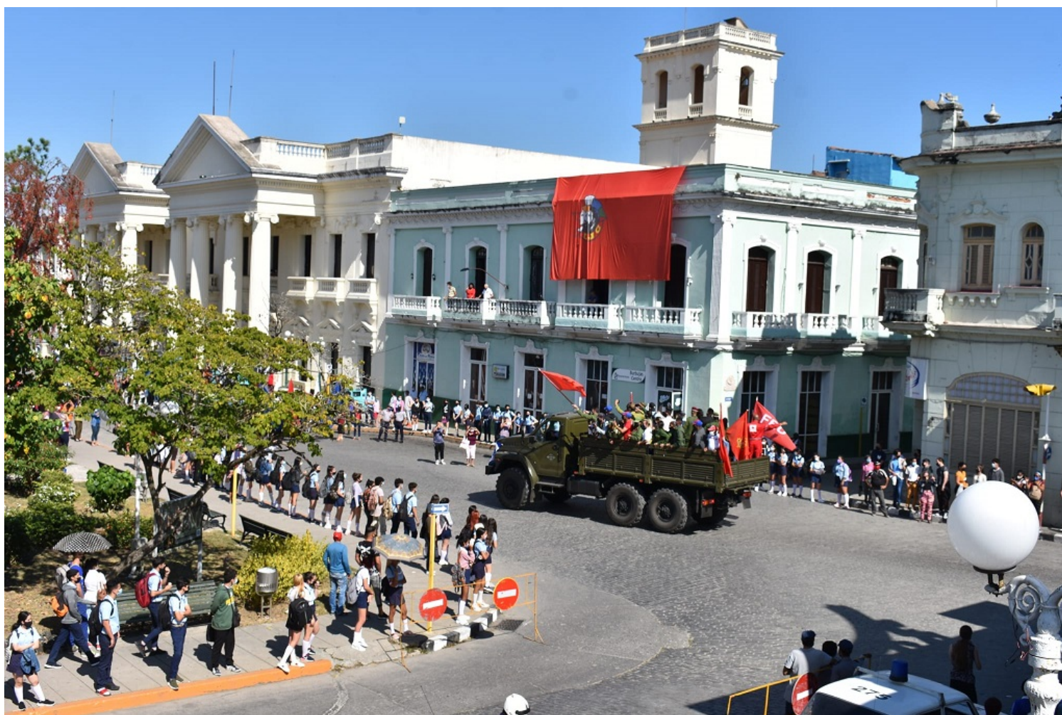
Caravana de la Libertad en Santa Clara.

Santa Clara 6 ene (RHC) Una representación de estudiantes y combatientes de Villa Clara reeditaron este sábado la entrada de la Caravana de La Libertad a ese territorio, como mismo sucedió hace 65 años, al mando de Fidel Castro, luego del triunfo de la Revolución Cubana.