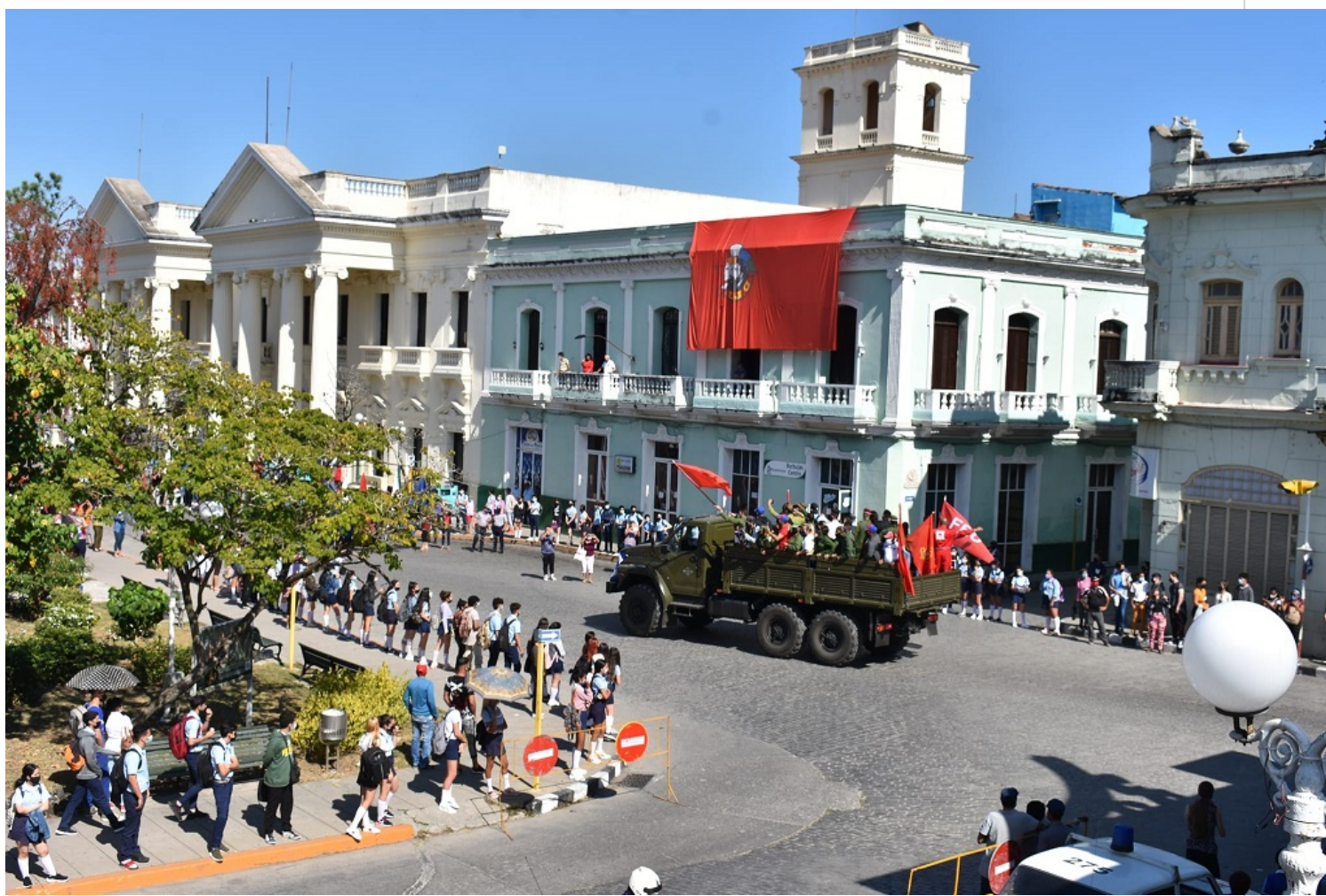
Caravana de la Libertad en Santa Clara.

Santa Clara 6 ene (RHC) Una representación de estudiantes y combatientes de Villa Clara reeditaron este sábado la entrada de la Caravana de La Libertad a ese territorio, como mismo sucedió hace 65 años, al mando de Fidel Castro, luego del triunfo de la Revolución Cubana.