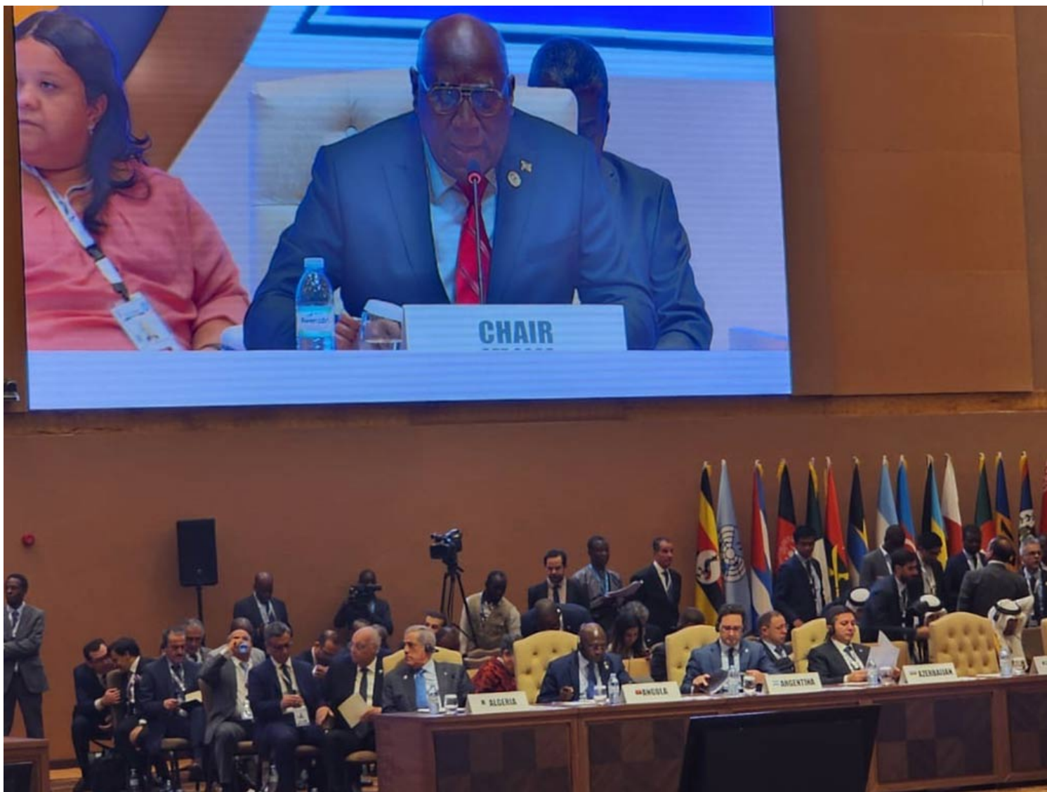
Valdés Mesa en Cumbre del Sur, en Uganda.