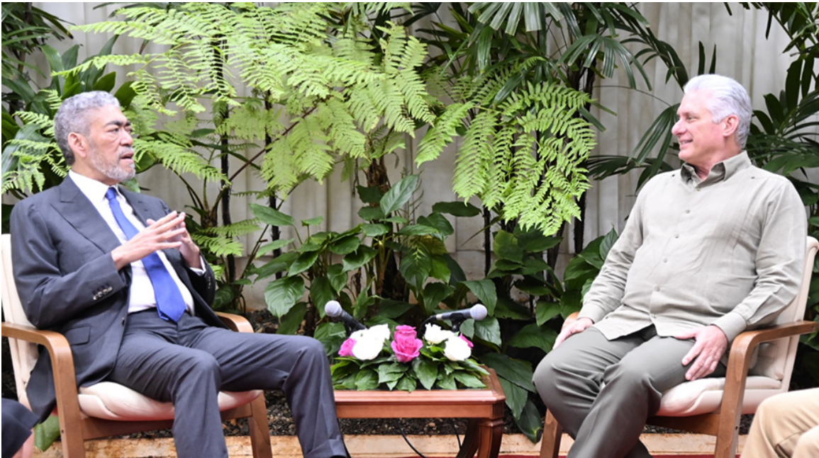
Encuentro entre el presidente cubano y el secretario general del Partido Movimiento Izquierda Unida de República Dominicana.

“¡Aquí estamos! ¡Venceremos!”. Así, con el entusiasmo que suelen traer los amigos, habló en la tarde de este miércoles el secretario general del Partido Movimiento Izquierda Unida (MIU) y ministro de Políticas de Integración Regional de República Dominicana, José Miguel Mejía Abreu, al ser recibido por el presidente de la República de Cuba, Miguel Díaz-Canel Bermúdez.