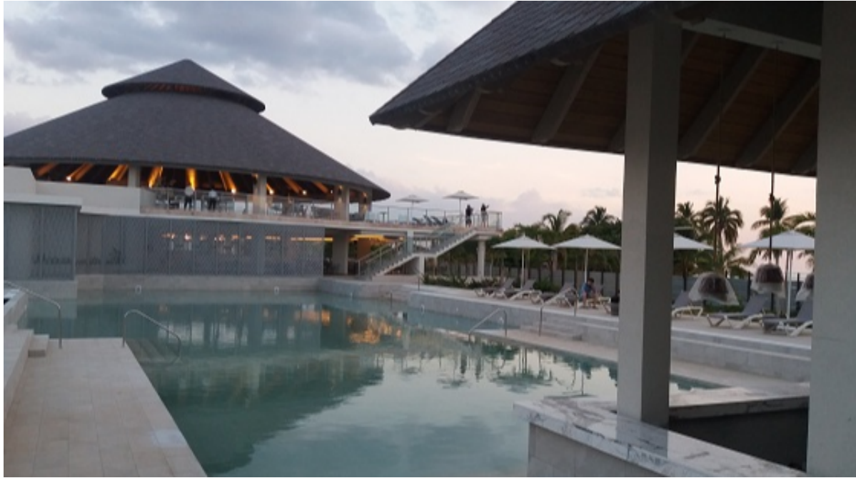
Áreas exteriores de la instalación trinitaria.

Esa cadena mallorquina hoy está presente en casi la totalidad de los más importantes polos turísticos cubanos.