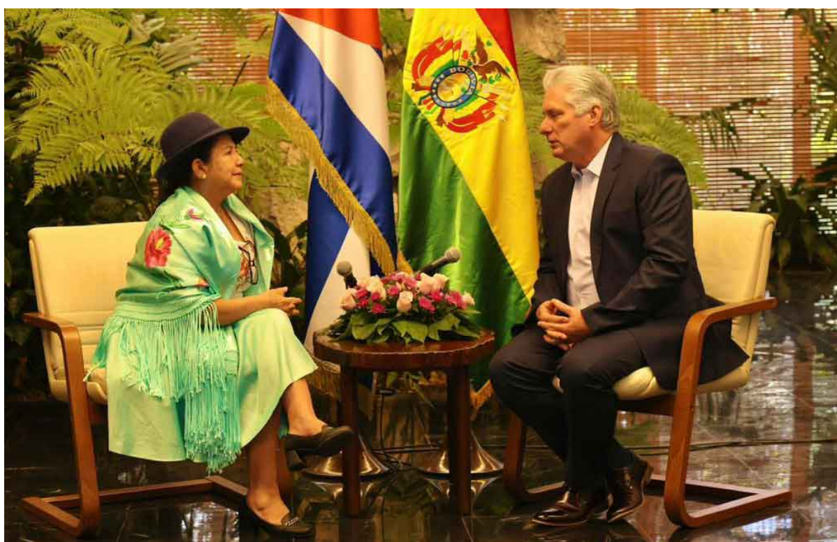
Díaz-Canel reconoció el apoyo constante de Bolivia en la lucha contra el bloqueo de EEUU a Cuba.

La Habana, 12 feb (RHC) El primer secretario del Comité Central del Partido Comunista de Cuba y presidente de la República, Miguel Díaz-Canel agradeció este lunes el amor y solidaridad inquebrantable de Bolivia hacia su país, durante un encuentro con la canciller Celinda Sosa.