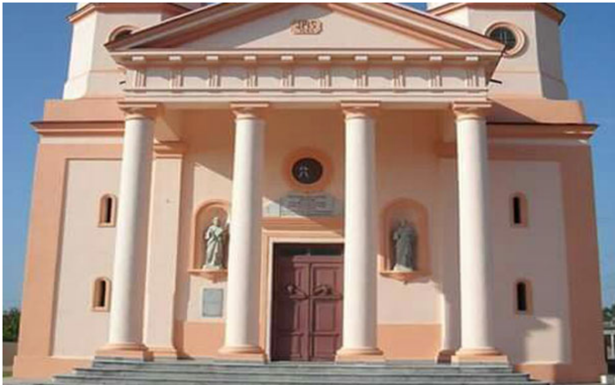
Fachada de la catedral de San Rosendo

Se trata de un templo ecléctico de tres naves; y aunque tiene mayor proximidad al estilo neoclásico, también muestra elementos distintivos del barroco.