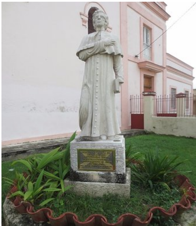
Escultura en recordación a Felix Varela

La acompaña una tarja con la frase: “Buscar la gloria de Dios en todo, santificando nuestras acciones, tendidos hacia el amor al prójimo”, de Varela.