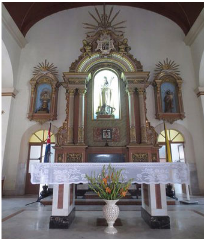
Altar Mayor de la Catedral de San Rosendo

Esa diócesis abarca a la provincia de Pinar del Río y a la mitad occidental de Artemisa, o sea, los municipios de San Cristóbal, Bahía Honda, Candelaria, Artemisa, Guanajay y Mariel.