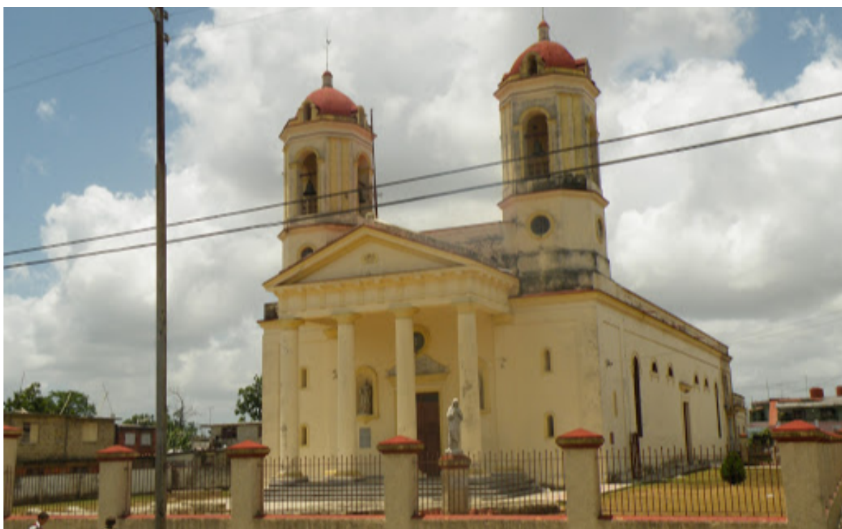
Catedral de San Rosendo