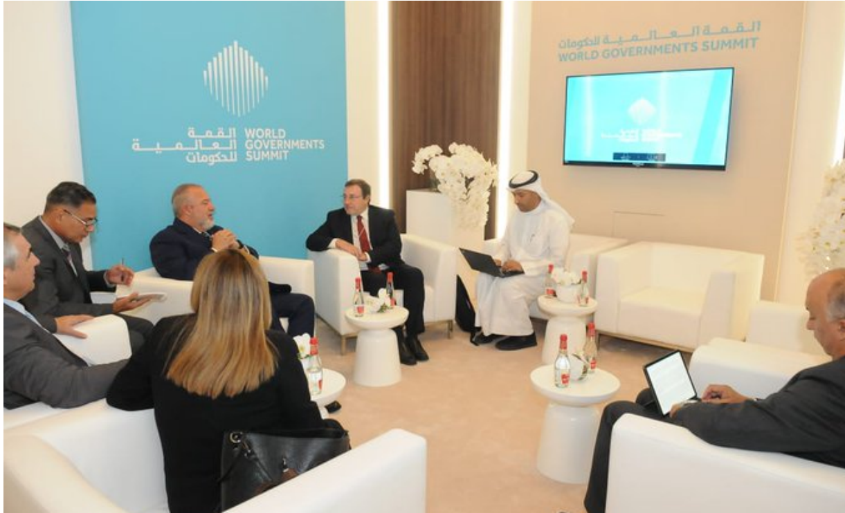
Marrero sostuvo un encuentro con Achim Steiner.

El primer ministro también sostuvo un encuentro con el administrador del Programa de las Naciones Unidas para el Desarrollo (PNUD), Achim Steiner, quien valoró el trabajo de Cuba en el ámbito de la promoción de incentivos para impulsar el desarrollo, y destacó la manera coordinada en que se trabaja con el PNUD.