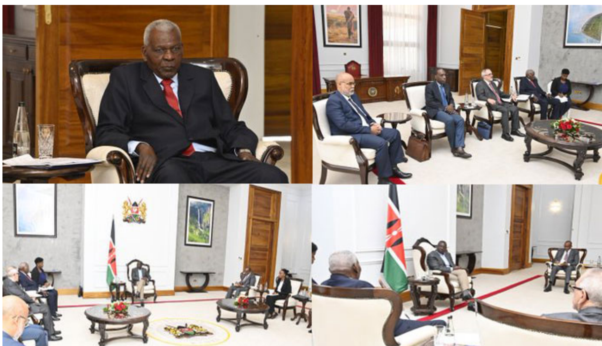
Esteban Lazo se reúne con presidente de Kenia.

Nairobi, 22 feb (RHC) El presidente de parlamento de Cuba, Esteban Lazo, dialogó a su llegada a Kenia con el mandatario William Ruto, en el contexto de la visita que realiza como Enviado Especial del Gobierno de su país.