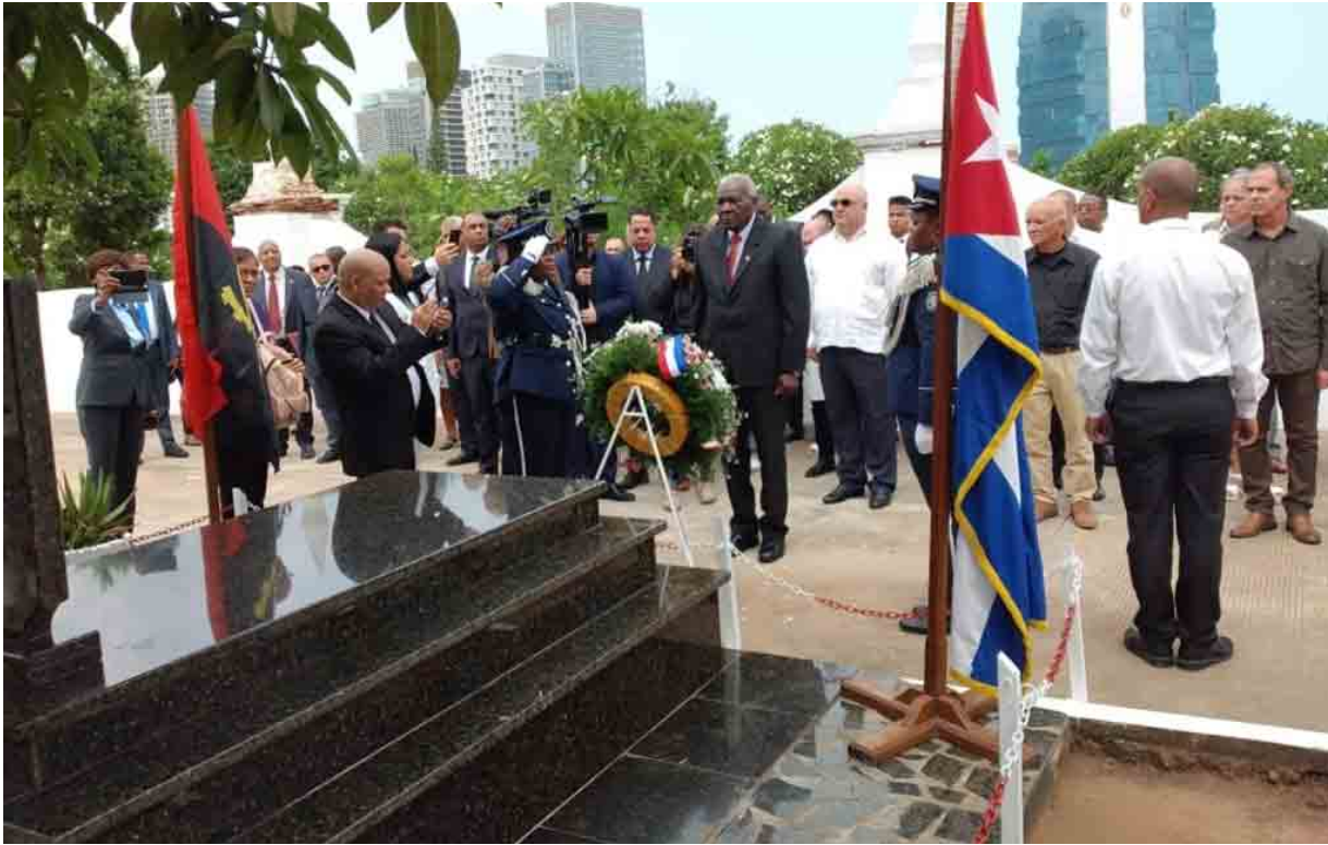
Esteban Lazo depositó ofrenda floral Antonio Antunes Fonseca

En el mausoleo que guarda sus restos depositó una corona de flores al igual que en el sarcófago del expresidente José Eduardo dos Santos.