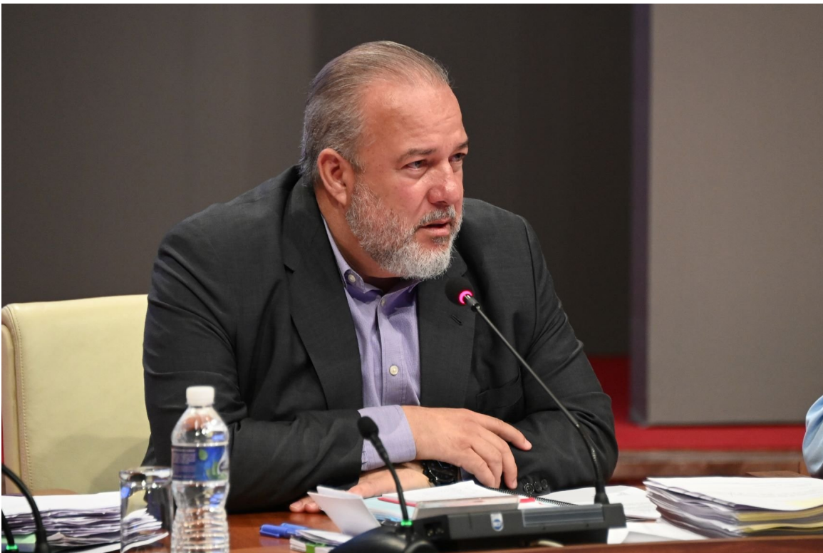
Como “hilo conductor para el trabajo en estos momentos” definió el Primer Ministro, Manuel Marrero

Los resultados del Plan de enero, consideró, no han sido buenos. “Nos corresponde a todos, con los recursos que tenemos, buscar las mejores soluciones para impactar positivamente en los resultados del mes de marzo”, valoró.