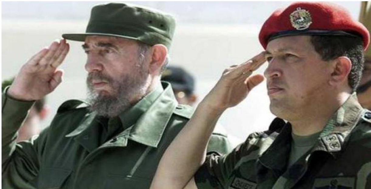
Fidel y Chávez

Millones son los cubanos que de una forma u otra estuvimos ligados a la relación entre Cuba y Venezuela fundada entre Chávez y Fidel desde la cooperación en salud, deporte, cultura, educación, ahorro energético, agricultura y la formación de trabajadores sociales venezolanos en Cuba.