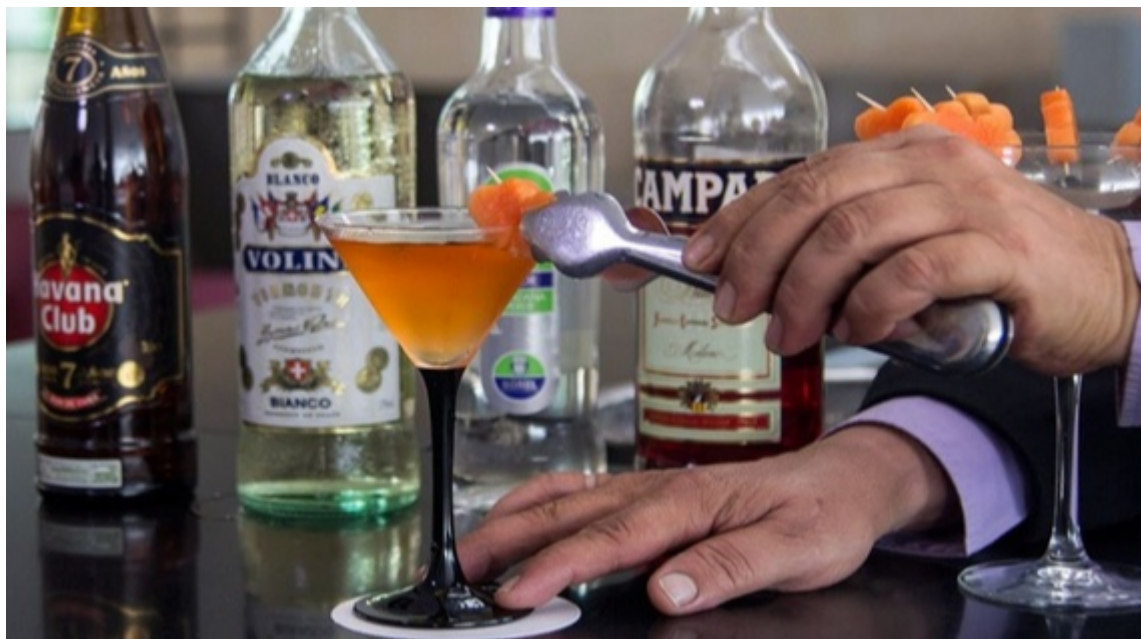
Coctelería en Cuba

La Habana, 26 mar (RHC) Como parte de las prácticas para reforzar el turismo en Cuba, hoy se aprecia entre los profesionales de la cantina un incremento del estilo libre o Flair.