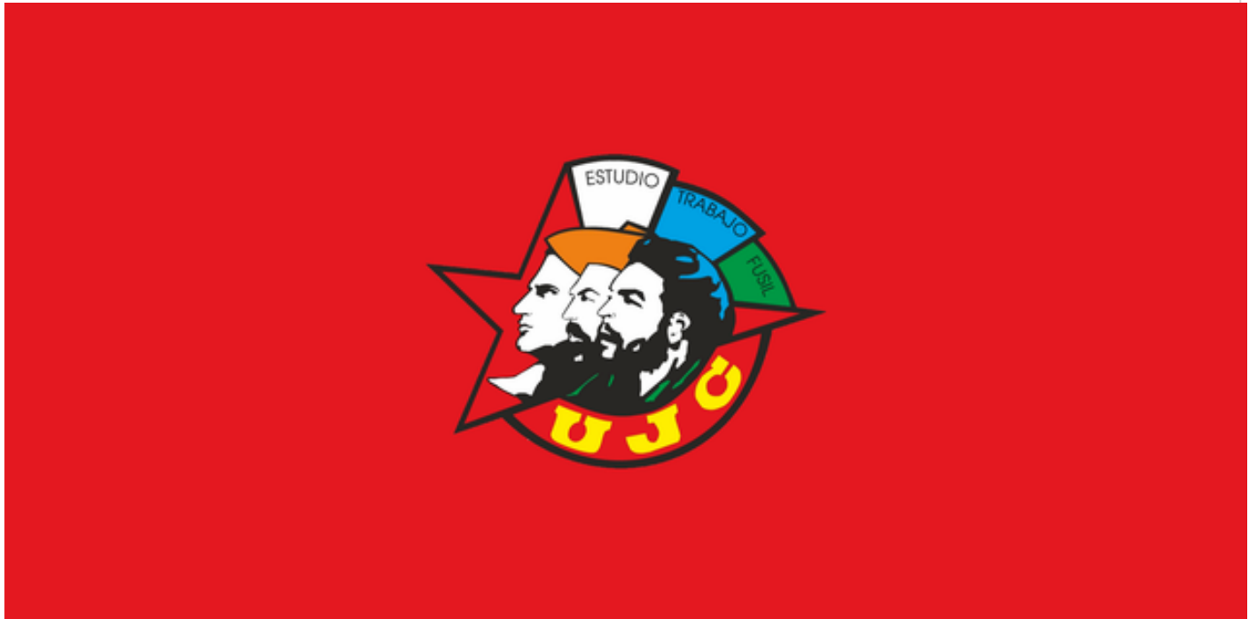
Logo de la UJC de Cuba