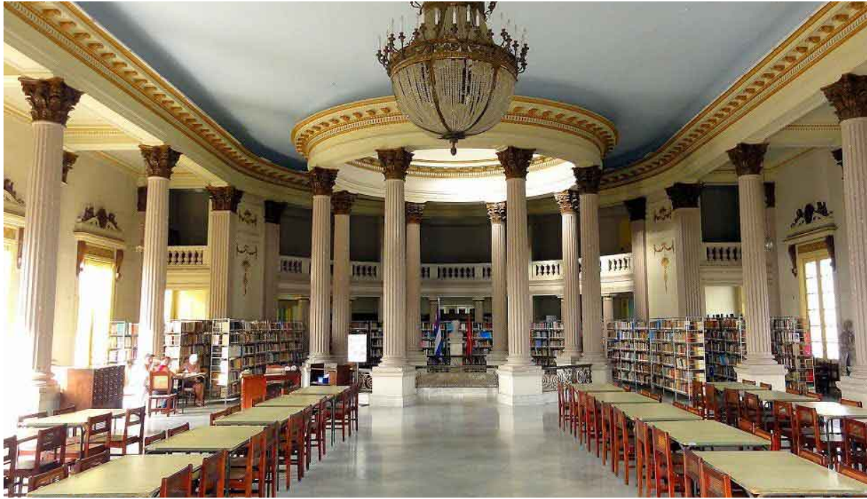
Salón de Lectura.

Fue el edificio más importante erigido en la época neocolonial, desborda en majestuosidad por su estilo único en tener una cúpula donde sobresalen vistosos vitrales, construidos en la primera mitad del siglo XX.