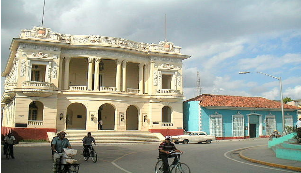
Biblioteca a un lado del parque

La Biblioteca provincial, a uno de los lados del Parque Serafín Sánchez atesora fondos locales, regionales, internacionales y una de las colecciones más importantes de la literatura nacional, universal y otra diversidad de documentos valiosos.