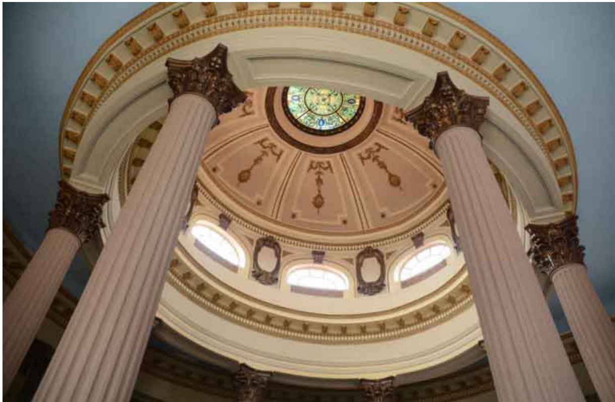
Cúpula de la edificación.

Bajo la dirección del arquitecto local Alberto Luis Mendigutía y la ejecución de Pepe Trelles, fue colocada la primera piedra el 10 de octubre de 1927.