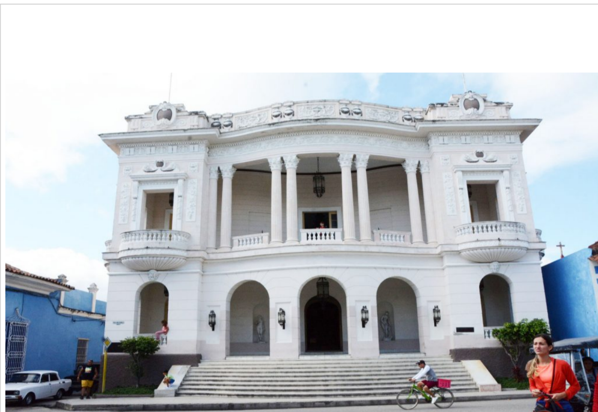
Biblioteca Rubén Martínez Villena

El edificio donde radica la Biblioteca Rubén Martínez Villena en la villa de Sancti Spíritus próxima a festejar sus 510 años de fundada por los españoles, es hoy una de las obras arquitectónicas más elegantes de la ciudad.