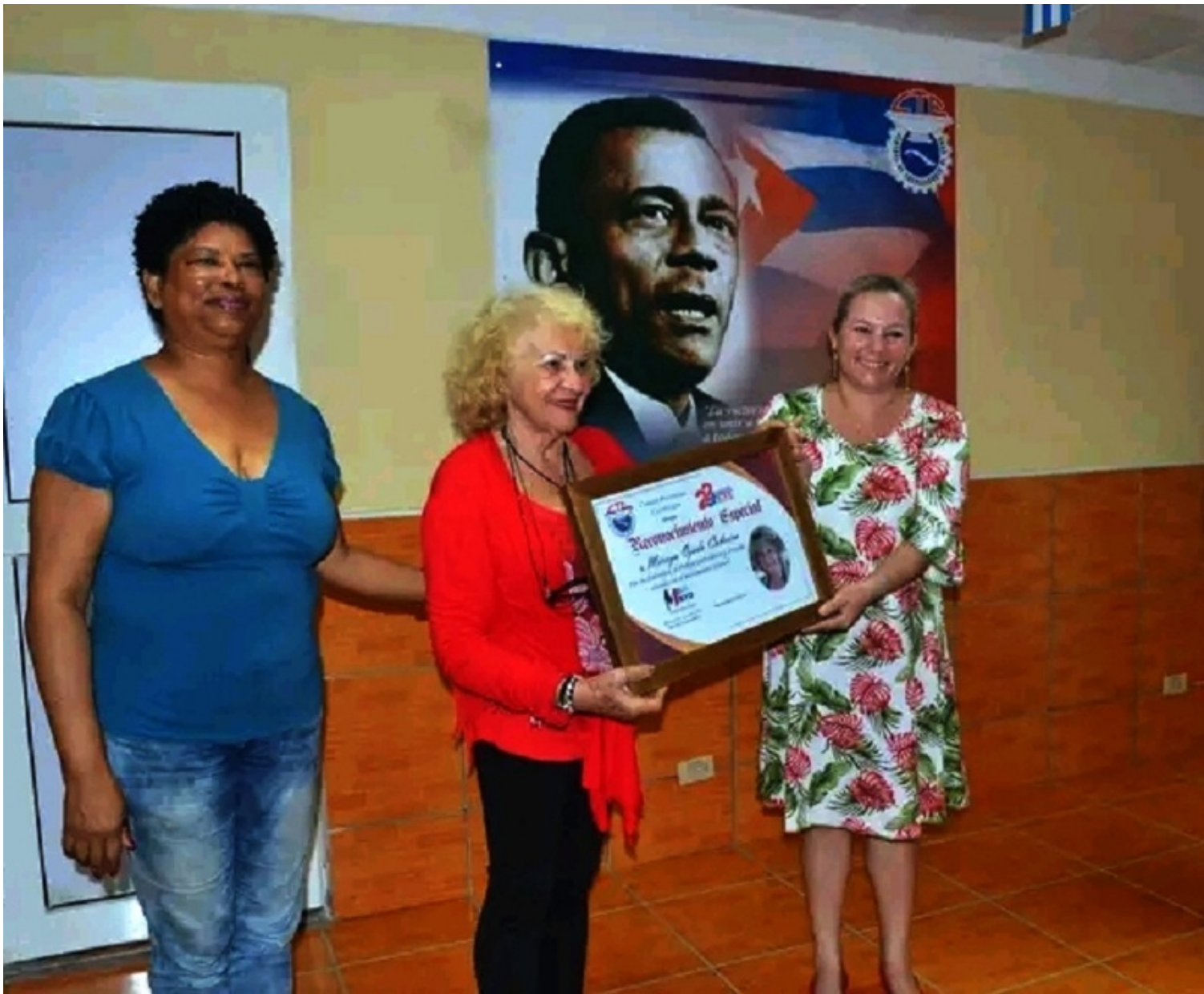
*corresponsal de Radio Habana Cuba en Cienfuegos

https://www.radiohc.cu/noticias/nacionales/351669-brigada-internacional-primer-de-mayo-visitara-la-provincia-de-cienfuegos-foto