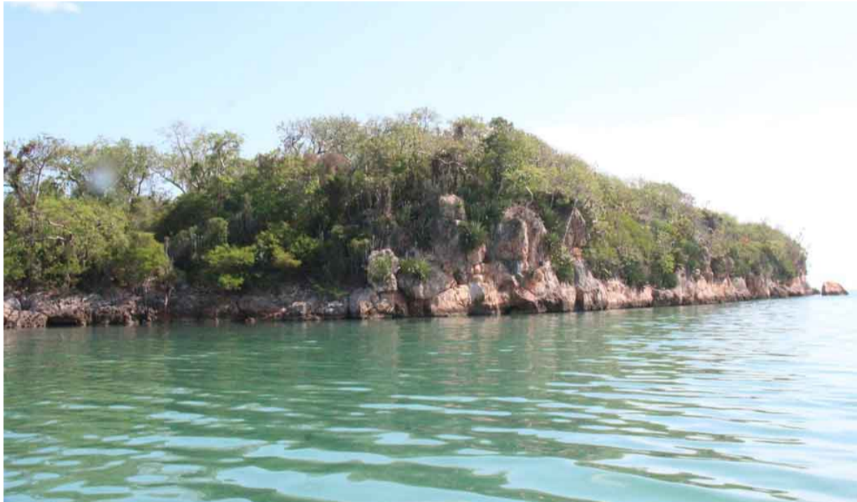
Parque Nacional Caguanes.