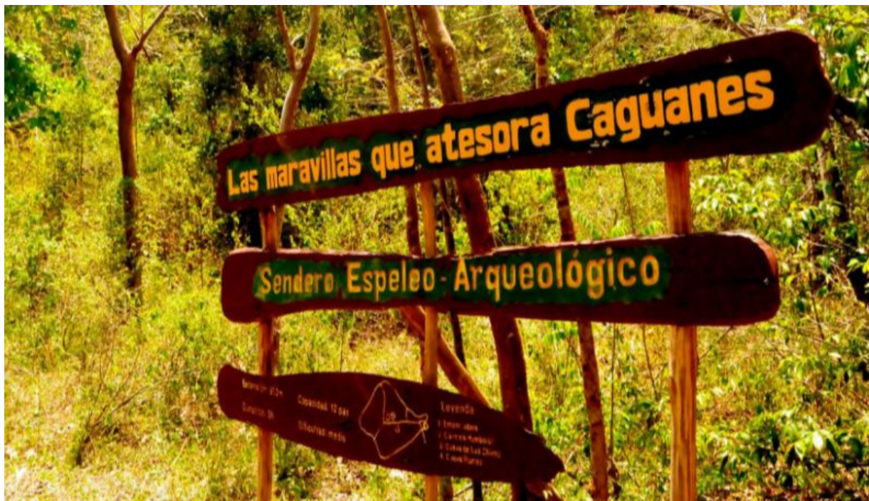
Parque Caguanes.

Sancti Spíritus, 16 abr (RHC) El Parque Nacional Caguanes (PNC), enclavado en el norteño municipio de Yaguajay, de esta provincia, exhibe hoy importantes niveles de recuperación de los manglares, uno de los ecosistemas que sufrió el impacto del huracán Irma en 2017.