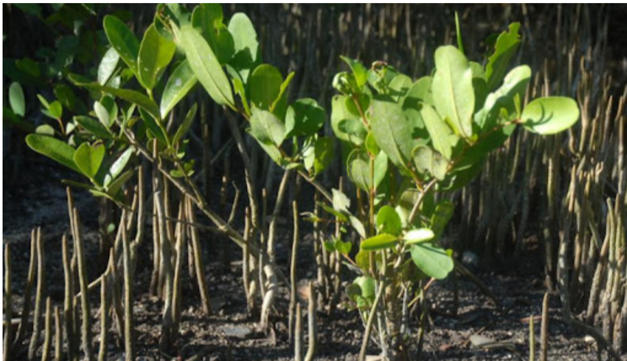
Manglares del Parque Nacional Caguanes.

Expertos que laboran en dicho parque coinciden en que la imagen cambió de manera favorable, apreciándose una regeneración natural de los manglares, los cuales requieren del monitoreo constante de la reforestación de las áreas y de la naturaleza.