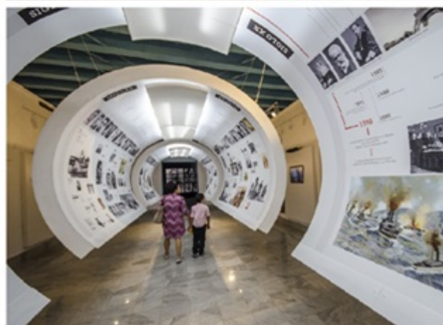
Dia Internacional dos Museus.

Havana, 13 de maio (RHC) Para celebrar o Dia Internacional dos Museus, o Escritório do Historiador de Havana organizou um programa variado de 14 a 18 de maio.