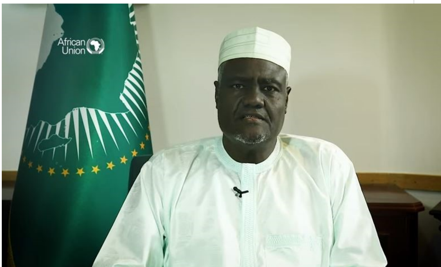
Moussa Faki Mahamat.

Addis Abeba, 25 may (RHC) El presidente de la Comisión de la Unión Africana (UA), Moussa Faki Mahamat, destacó la liberación del continente del yugo del colonialismo y del apartheid y su desarrollo a propósito de conmemorarse hoy el Día de África.