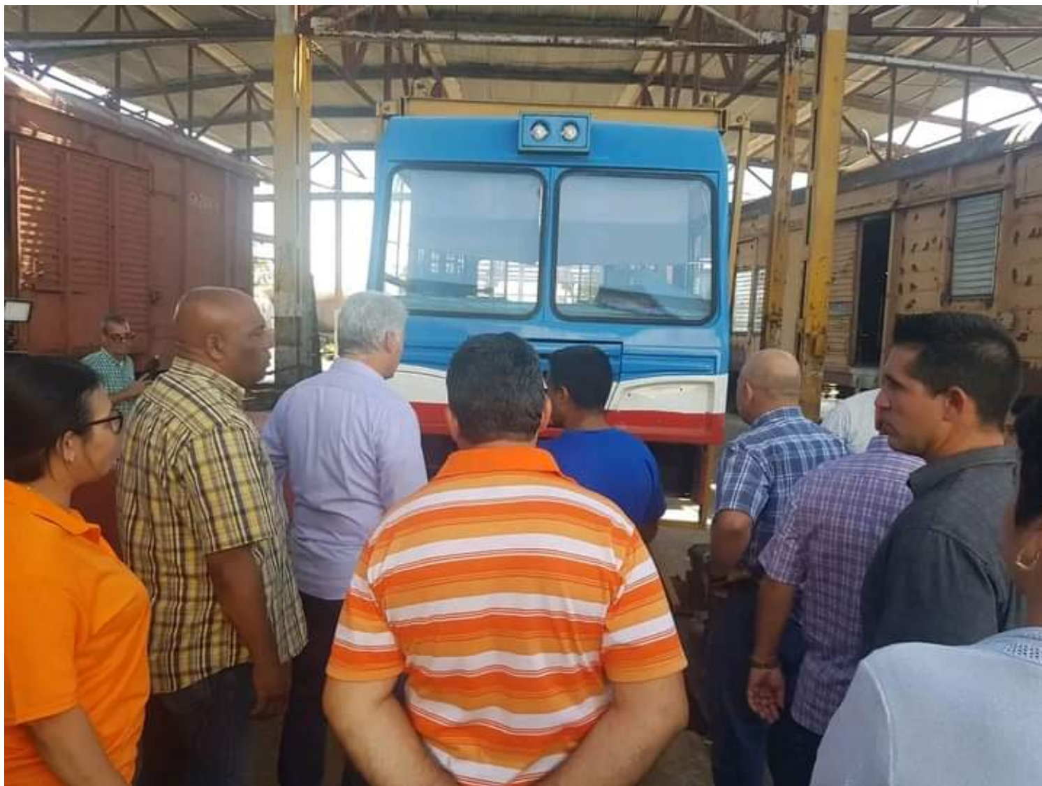
UEB Ferrotalleres 9 de abril.

Más tarde, Díaz-Canel intercambió con directivos y trabajadores de la UEB Ferrotalleres 9 de abril, dedicado a la recuperación de silos y vagones de carga, así como a la adaptación de ómnibus a las condiciones del Ferrocarril para el traslado de pasajeros