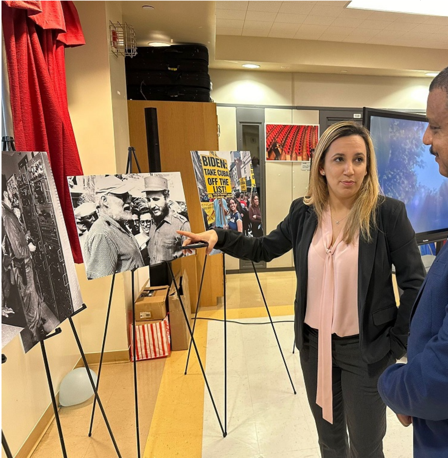
New York, 2 juin (RHC) L'exposition 65 ans au service de la vérité, composée de photographies de l'agence de presse Prensa Latina, a été inaugurée aujourd'hui dans cette ville dans le cadre des sessions du Congrès de la Presse Hispano-américaine.