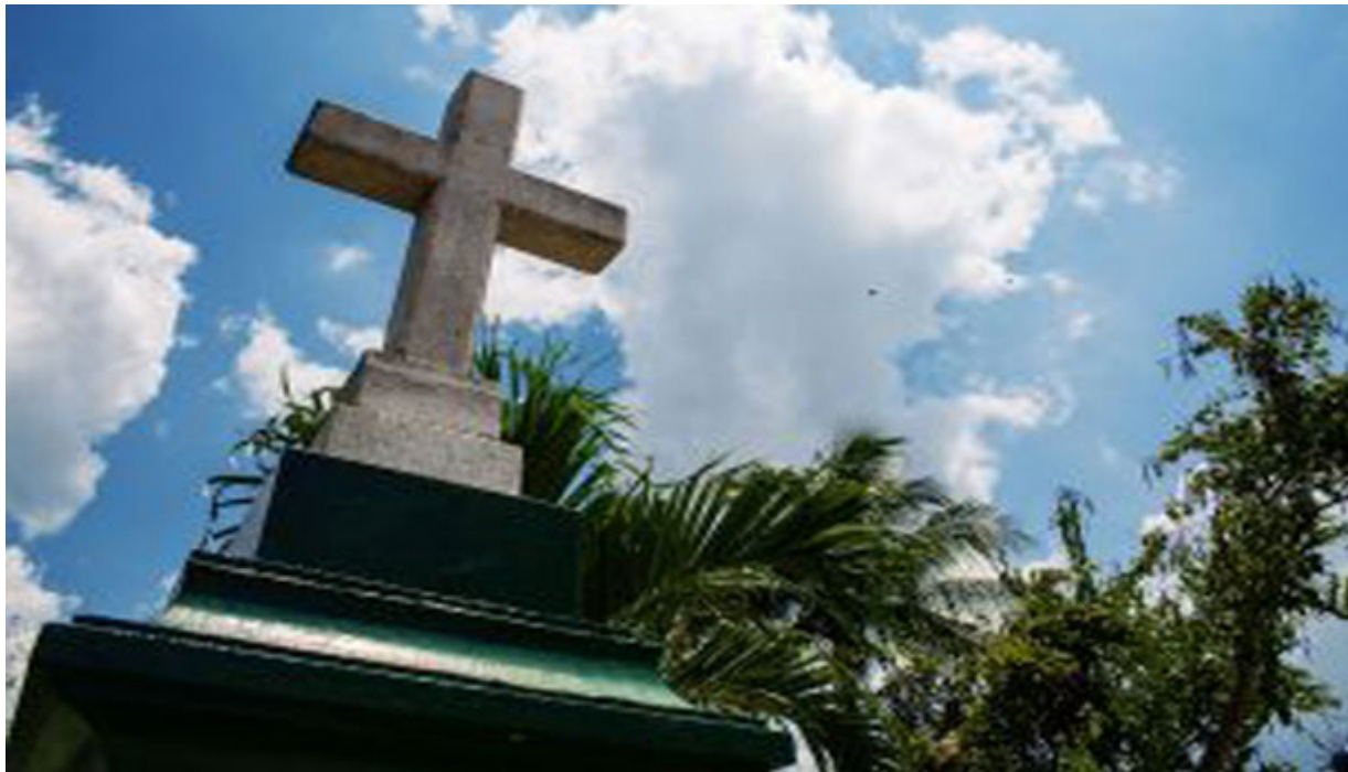
Cruz del Puente

Las actividades festivas se iniciaron con la diana mambisa y el tradicional encuentro simbólico en el Puente de La Cruz, a la sombra de un tamarindo entre los ríos Bélico y Cubanicay, con una representación de las familias de Remedios, primeros habitantes de la ciudad.