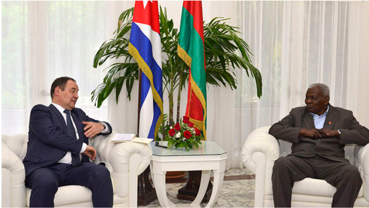
Esteban Lazo, dialogó con el primer ministro de Belarús