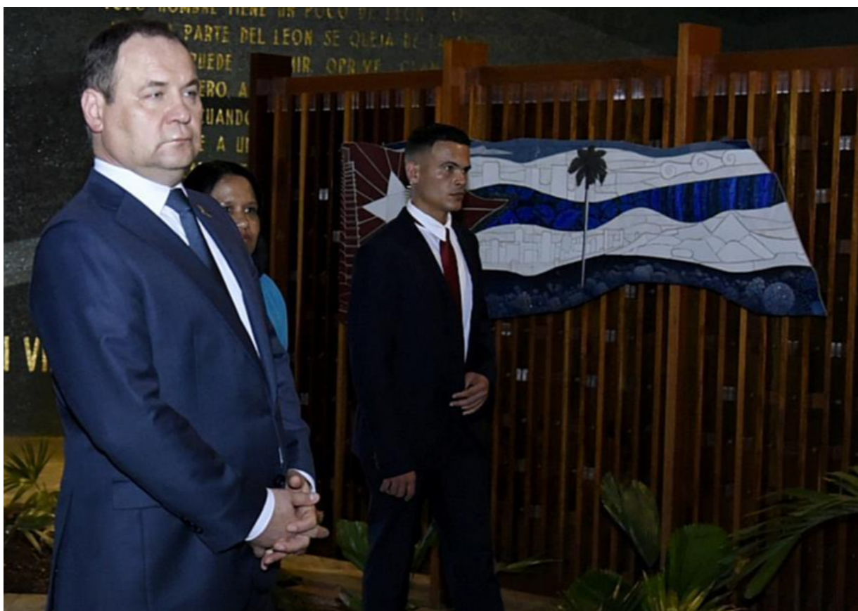
Primer ministro de Belarús, Román Golóvchenk visita Centro Fidel Castro

La Habana 17, julio (RHC) El primer ministro de Belarús, Román Golóvchenko, continúa hoy su visita oficial a Cuba, con un programa que incluye un recorrido por las áreas expositivas del centro Fidel Castro Ruz en esta capital.