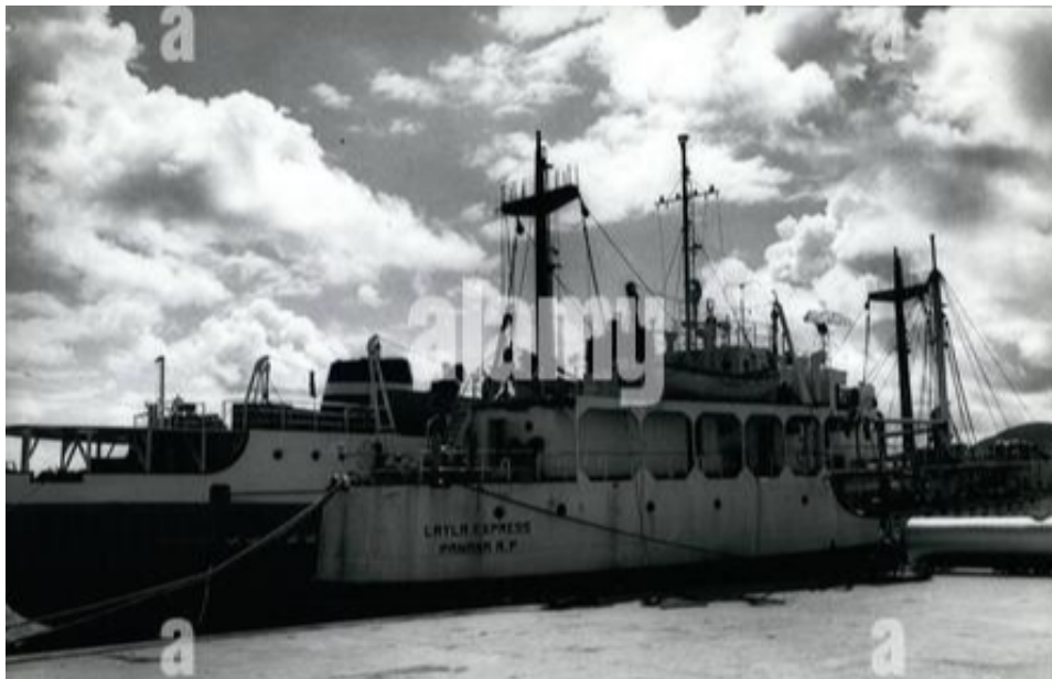
Buque Layla Express.