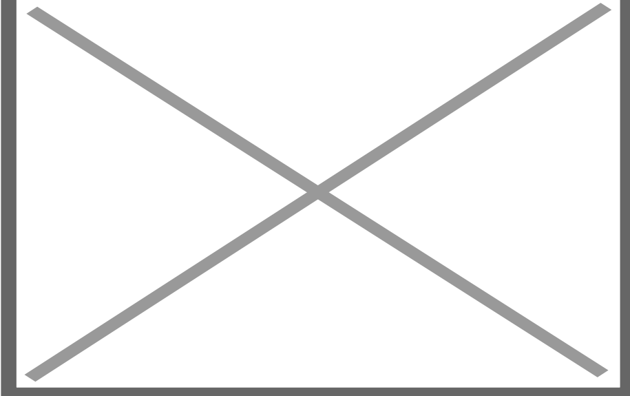
Buque Layla Express.