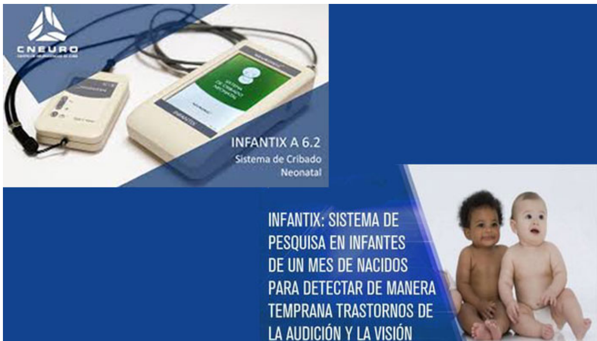
Sistema pesquisa infantil