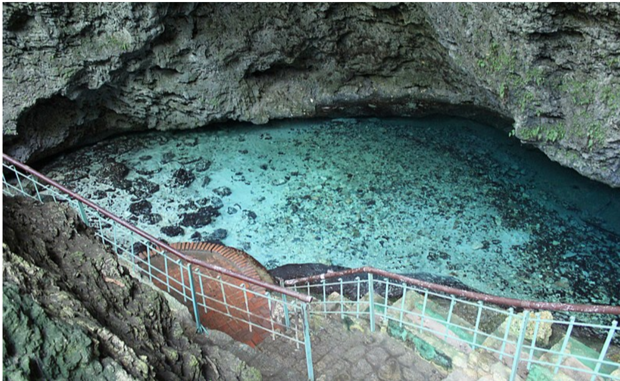
Lago los tres Ojos

El Lago la Nevera es el segundo manantial de este parque natural por sus temperaturas de 20 a 21 grados centígrados ( °C).