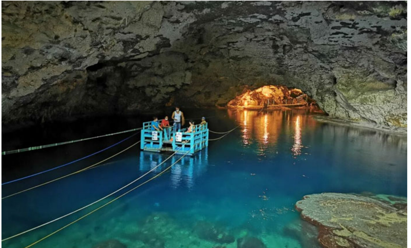
Lago Los Tres Ojos

El cuarto y último es el Lago Zaramagullón, y su nombre proviene de unos patos provenientes de África que lo habitan por un corto periodo para luego partir a su lugar de origen.