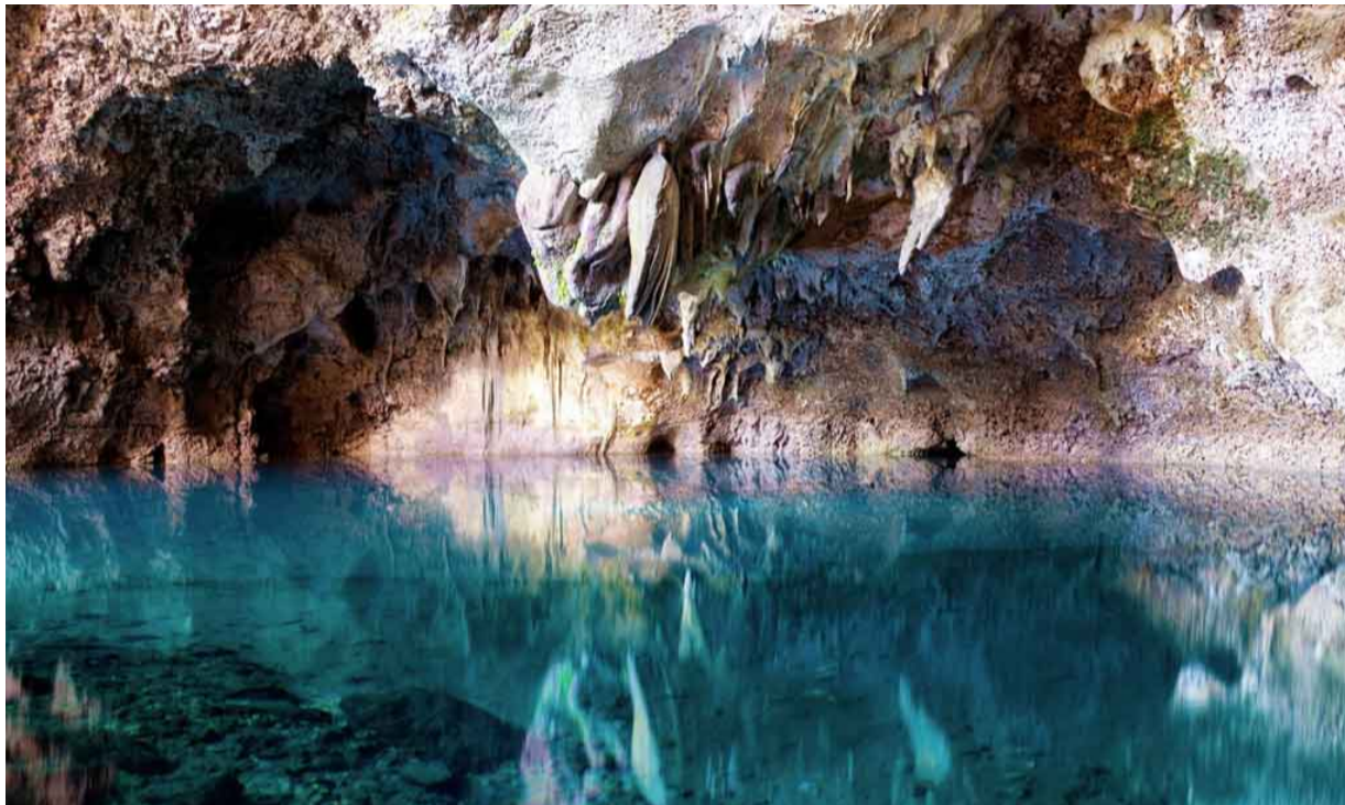
Lago los Tres Ojos

El primer manantial es el llamado Lago de azufre a 300 metros bajo tierra y cuenta con 4,5 metros de profundidad.