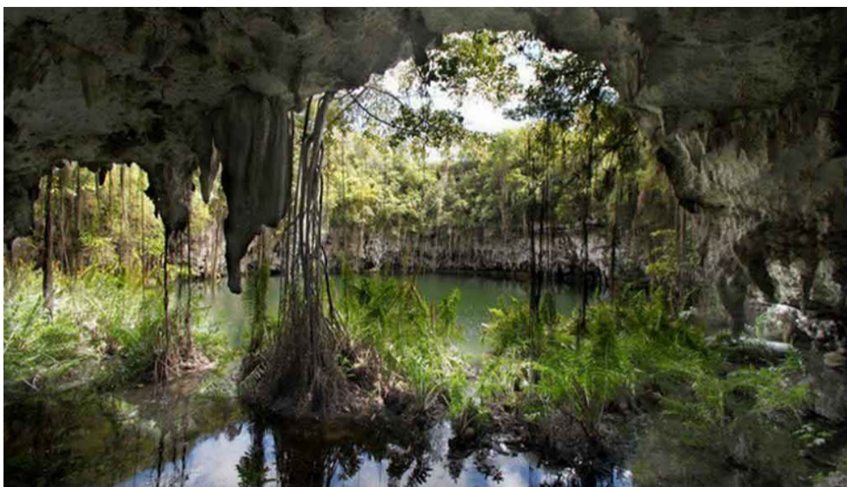
Parque Nacional Los Tres Ojos de la República Dominicana

La Habana, 12 sep (RHCa) El catedrático y analista cubano de temas turísticos José Luís Perelló, destacó hoy las bondades del Parque Nacional Los Tres Ojos de la República Dominicana, en medio del incremento global de viajes de naturaleza.