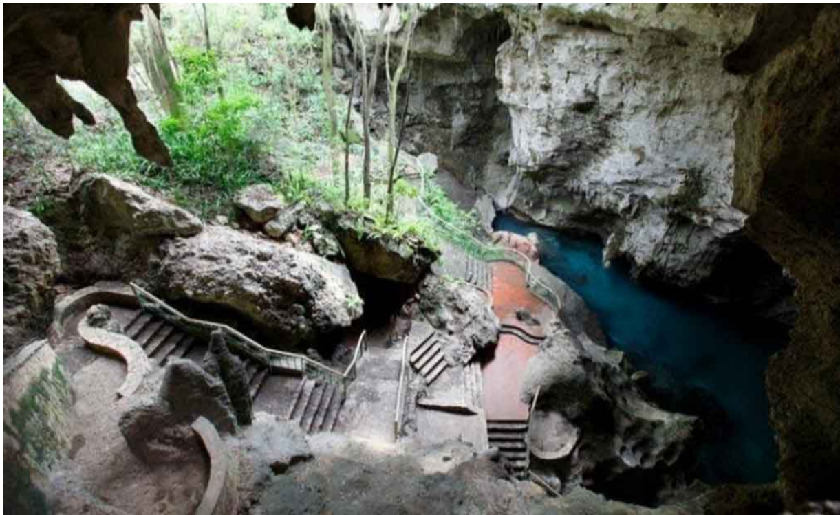
Escaleras del Parque Nacional Los Tres Ojos de la República Dominicana

Sin embargo, fue en 1968 cuando se dispuso que se construyeran las escaleras para que turistas visiten este lugar. En 1972 abrió sus puertas al público para los turistas extranjeros y dominicanos.