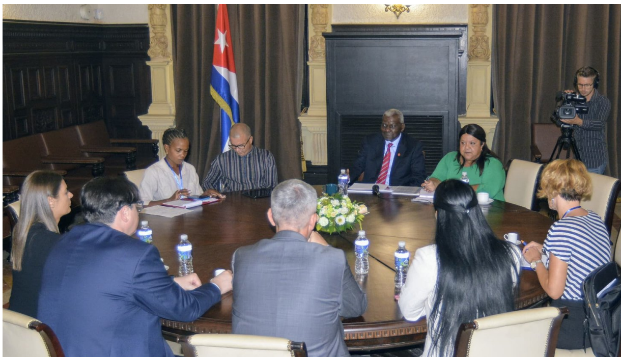
Lazo recibe grupo parlamentarios.

El Presidente de la Asamblea Nacional del Poder Popular de Cuba, ANPP, Esteban Lazo, también sostuvo conversaciones oficiales con Bojan Torbica, titular del Grupo Parlamentario de Amistad Serbia-Cuba.