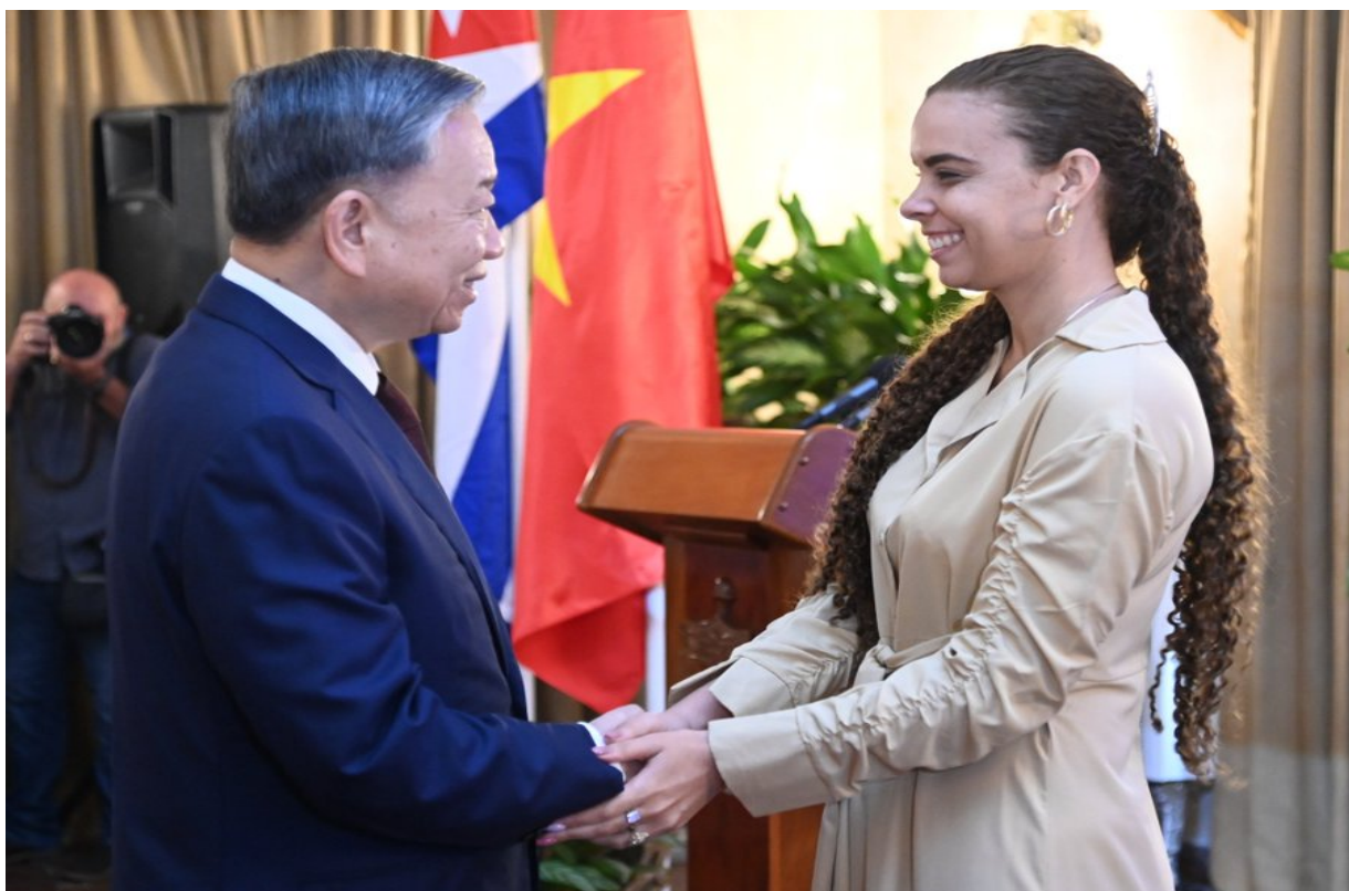
To Lam, entregó a la Unión de Jóvenes Comunistas de Cuba (UJC) la Orden de la Amistad

Durante el evento, el presidente de Vietnam, To Lam, entregó a la Unión de Jóvenes Comunistas de Cuba (UJC) la Orden de la Amistad, por su contribución activa a la consolidación y construcción de lazos socialistas.