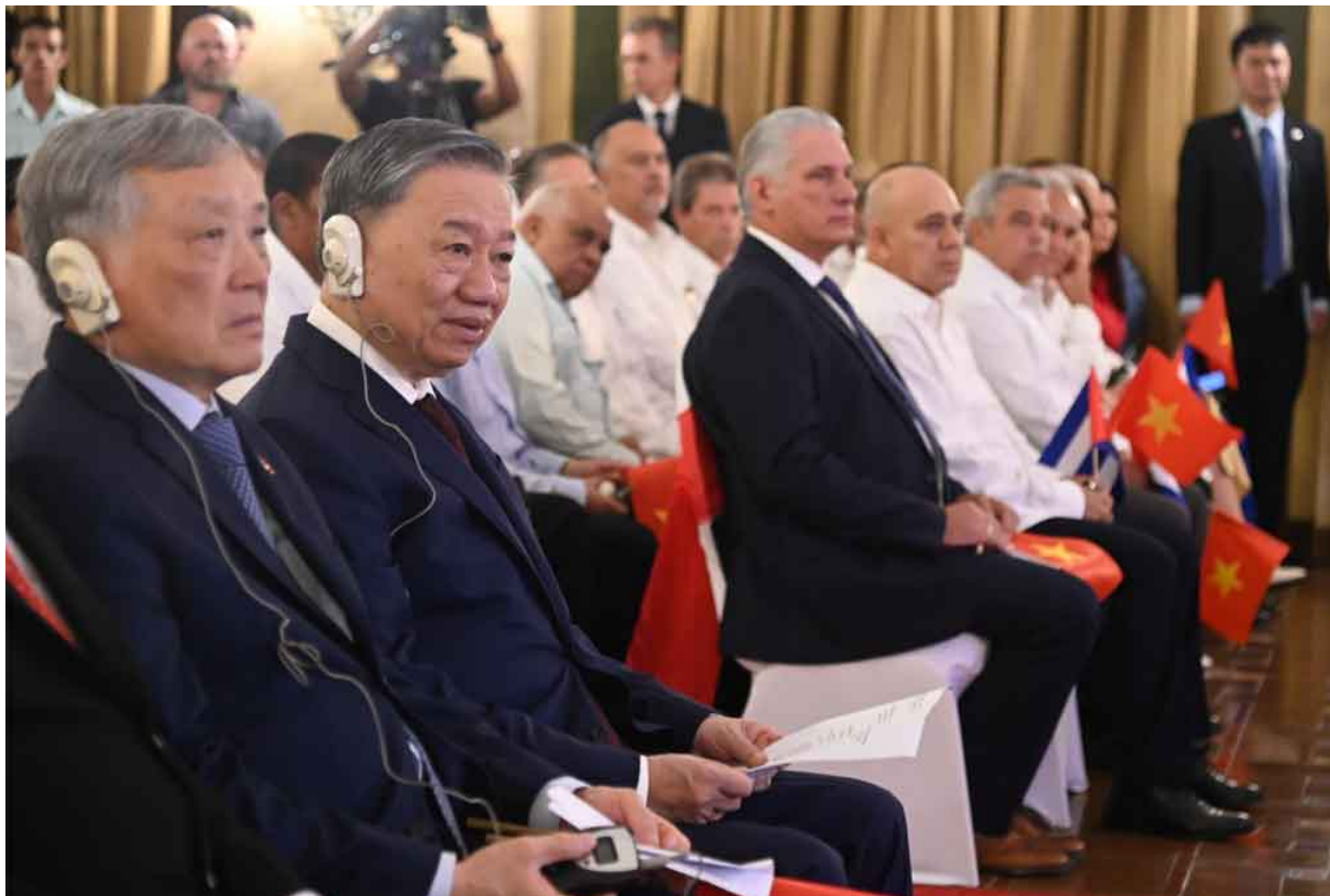
Encuentro de Solidaridad Cuba-Vietnam

La Habana, 27 sep (RHC) El presidente de Cuba, Miguel Díaz-Canel y To Lam, secretario general del Partido Comunista y presidente de Vietnam asistieron este viernes a un un Encuentro de Solidaridad celebrado en esta capital, con representantes del pueblo de Cuba.