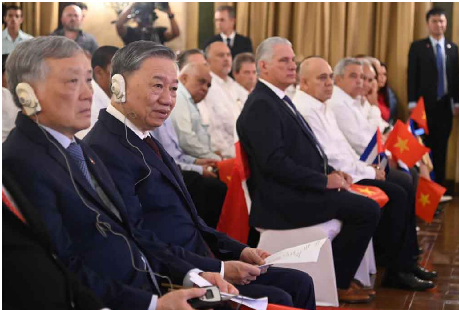
Encuentro de Solidaridad Cuba-Vietnam

La Havane, 27 sept (RHC) Le président cubain Miguel Díaz-Canel et To Lam, secrétaire général du Parti communiste et président du Vietnam, ont participé vendredi à La Havane à une réunion de solidarité avec des représentants du peuple cubain.