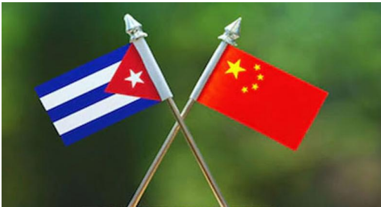
Comisión Mixta Cuba-China.

La Habana, 30 sep (RHC) La XIII Reunión de la Comisión Mixta para la Cooperación en Ciencia y Tecnología entre los gobiernos de Cuba y la República Popular China inició hoy en el Hotel Meliá Cohiba, de esta capital.