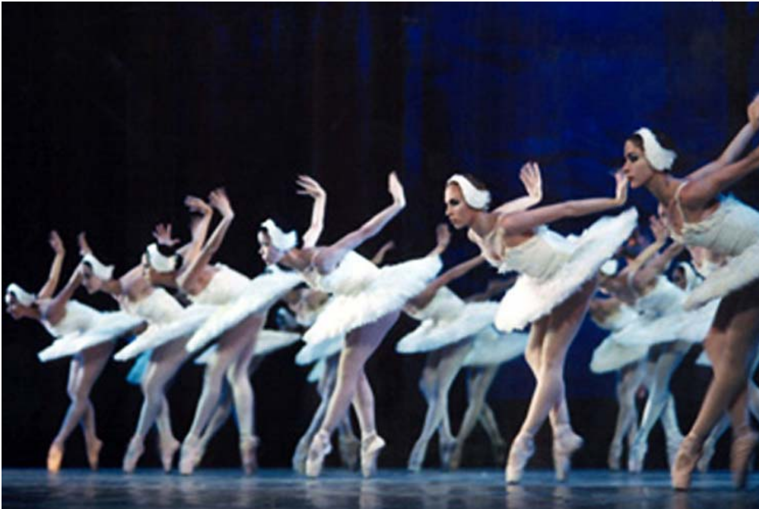
Ballet Nacional de Cuba

De igual manera, asistirán dos entrañables figuras que fueron primeros bailarines del BNC: el ruso Azari Plisetski y el cubano José Manuel Carreño, quienes tomarán ensayos, igual que la maestra inglesa Maina Gielgud, con una brillante carrera en el Ballet del Siglo XX de Maurice Bejart, entre otros conjuntos.