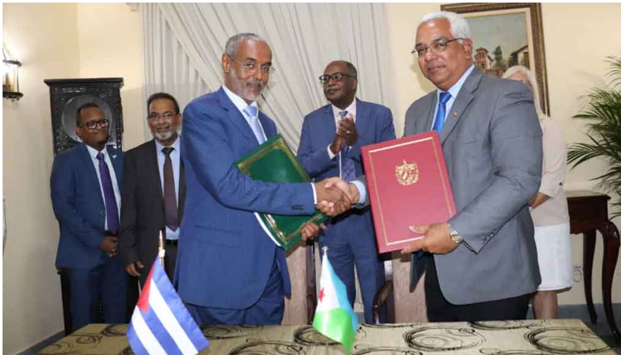
Firma de acuerdos Djibouti y Cuba

Destacó que la presencia de la delegación yibutiana tiene un significado muy especial a los ojos del gobierno en un momento en el que el país estaba doblemente afectado por la avería general del sistema eléctrico y el paso devastador del huracán Oscar, con un saldo de 8 fallecidos y cuantiosos daños materiales en la provincia de Guantánamo (oriente).