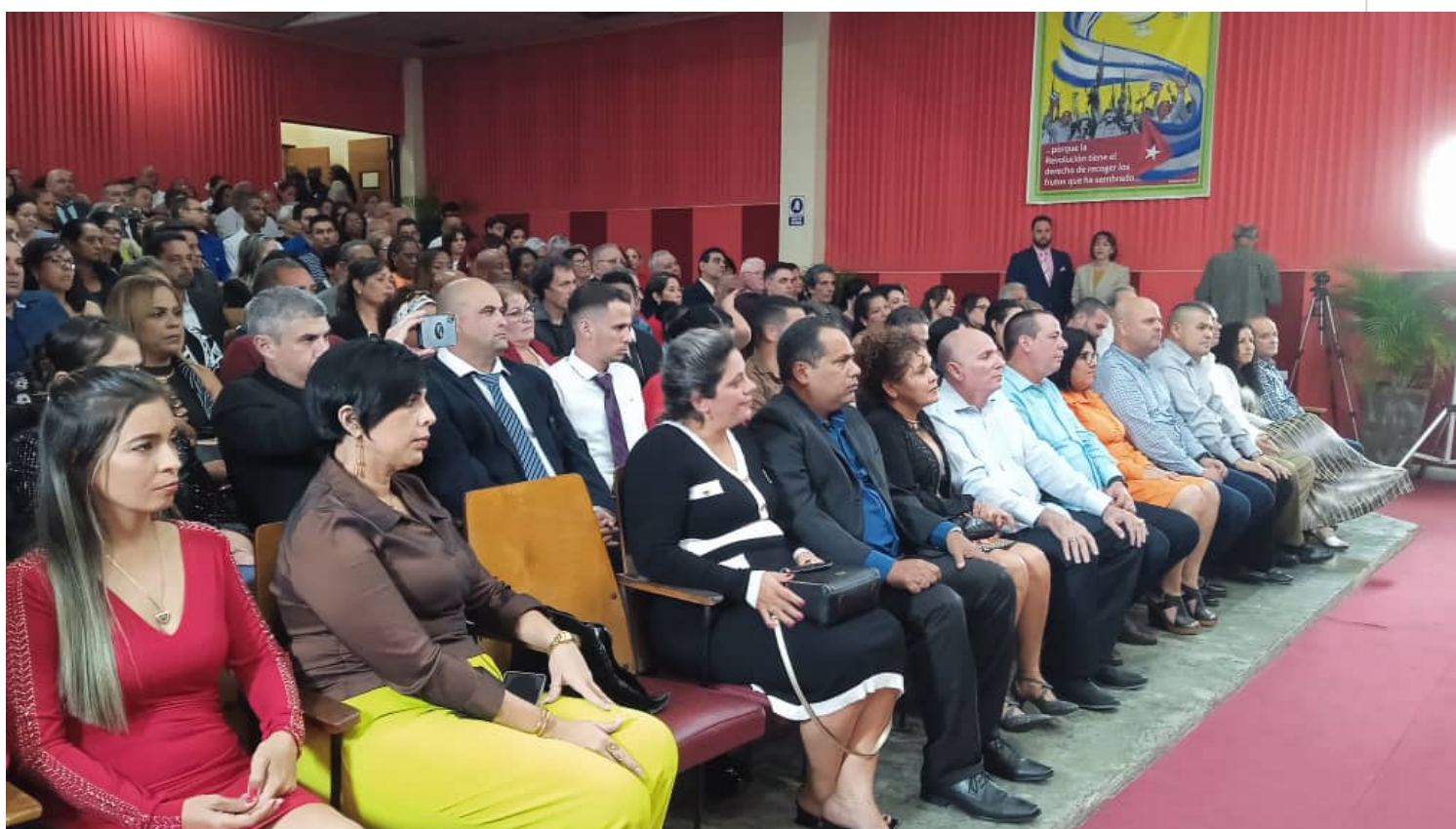
Ministro de Salud en la gala por el Día de la Medicina Latinoamericana.