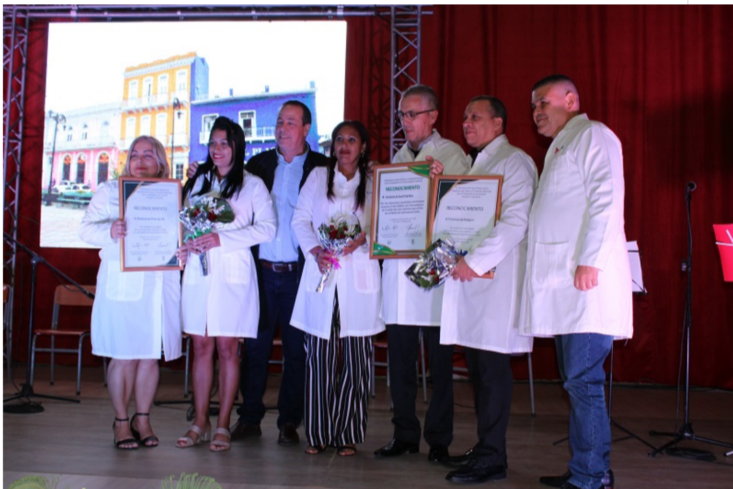
Durante la celebración fueron entregados varios reconocimientos.