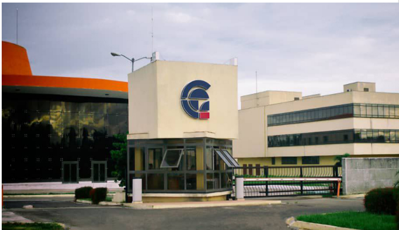
Centro de Estudios Avanzados