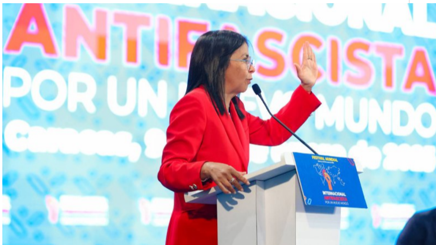
Delcy Rodríguez en la inauguración del Festival Mundial de la Internacional Antifascista.