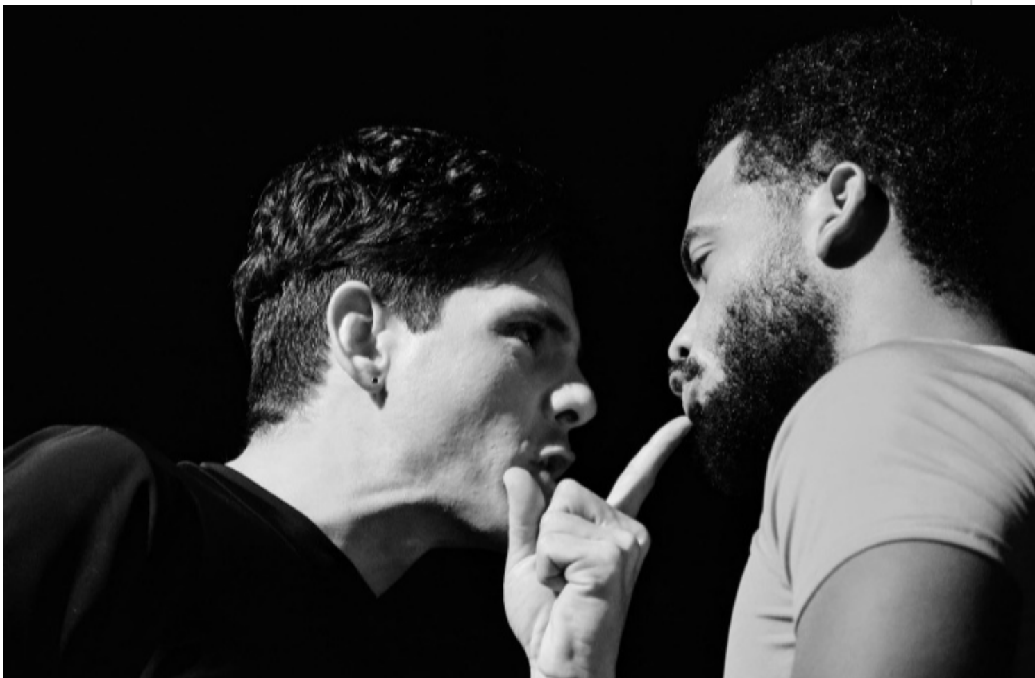
Escenas de Tango Pateticus.