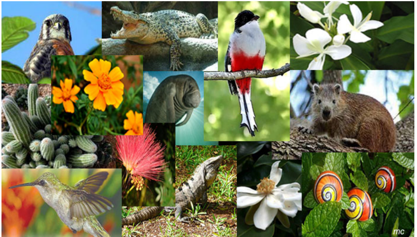
Flore y Fauna cubana.

La isla exhibe sistemas de terrazas, rica fauna silvestre, y el apoyo irrestricto de empresas como Flora y Fauna, tanto para el cuidado del medio ambiente como para la orientación a los viajeros.