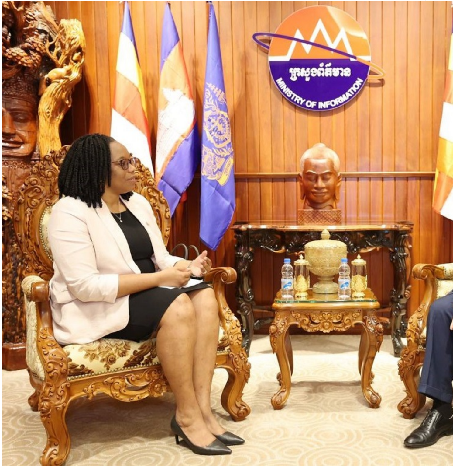
La Havane, 10 fév (RHC) Le ministre cambodgien de l'Information, Neth Pheaktra, a exprimé aujourd'hui sa volonté d'établir des canaux de dialogue avec les représentants de l'Institut de communication sociale de Cuba et d'approfondir les liens de coopération bilatérale existants.