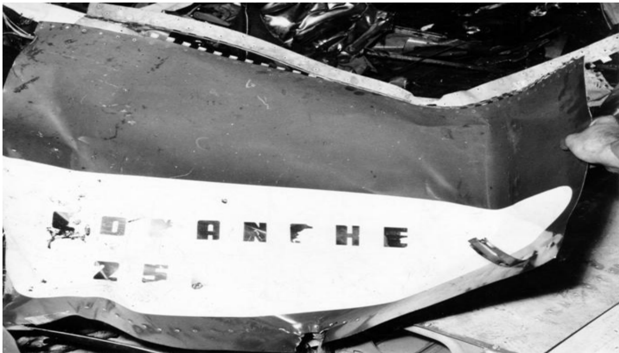
Restos del fuselaje de la Comanche 250 LYC que explotó en el central España.

La aeronave dio un giro sobre el batey y cuando ya estaba encima de las instalaciones del ingenio, uno de sus tripulantes, con las dos manos, trataba de sacar un bulto que, evidentemente, era una bomba. En ese momento se produjo una gran explosión que destruyó totalmente el aparato, cuyos restos, envueltos en una negra humareda, cayeron a tierra.