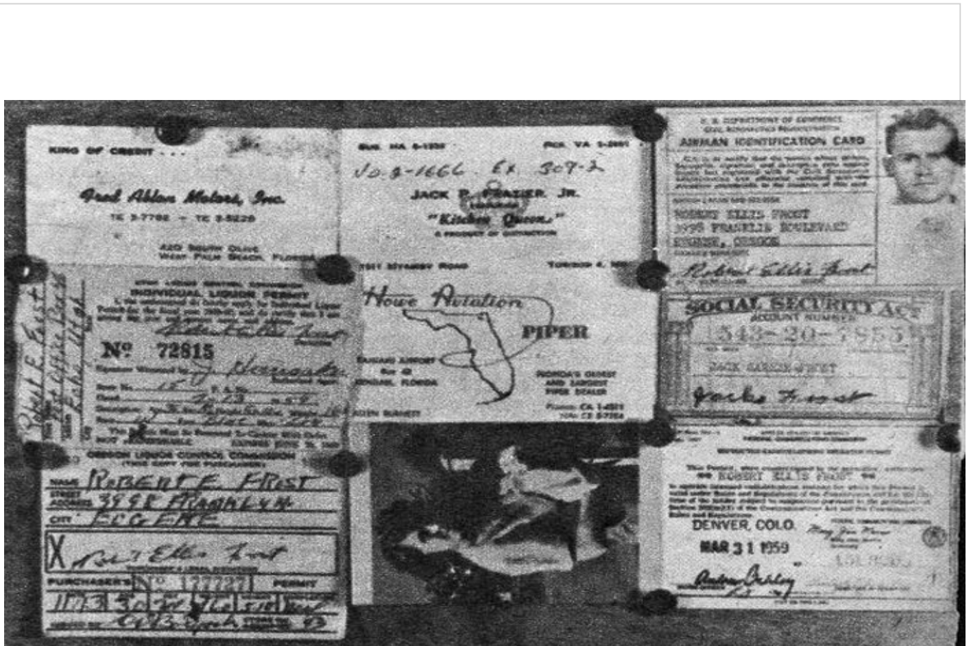
Documentos ocupados entre los restos de la avioneta pirata que explotó en el aire en el central España.

«Yo creo que ellos pararon un poco el motor, pues la avioneta se quedó como suspendida en el aire. Fue en ese momento que dejaron caer la "jamonada". Creo que en esa operación calcularon mal, pues tal parece que la cola de la avioneta fue la que chocó con lo que dejaron caer. Fue, en cuestión de segundos, la tremenda explosión».