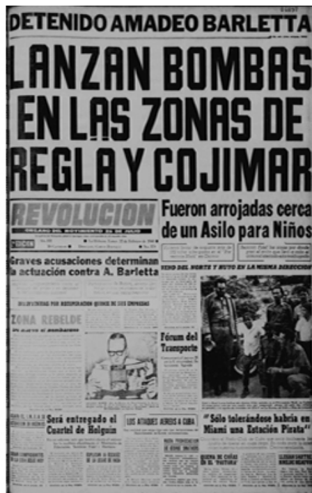
Recortes de periódicos de la época