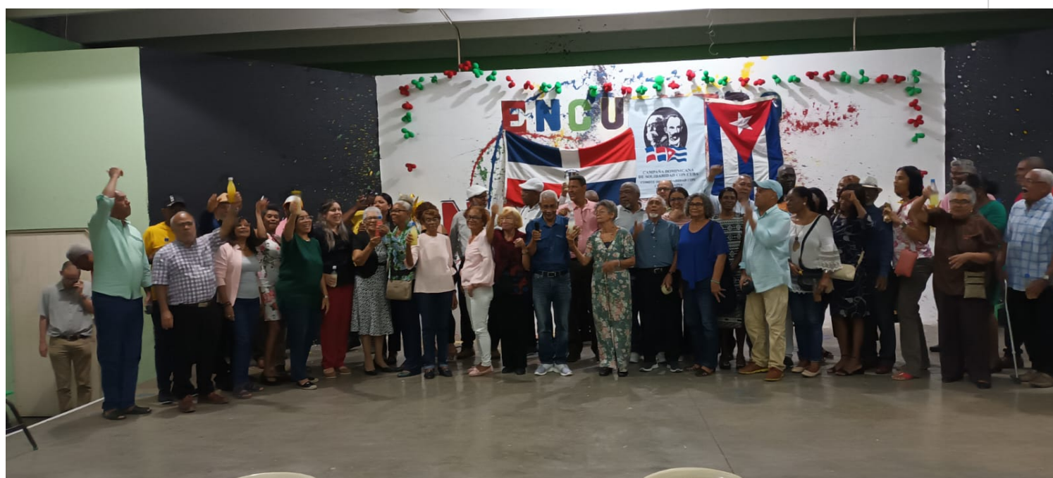
Integrantes de la Campaña Dominicana de Solidaridad con Cuba.